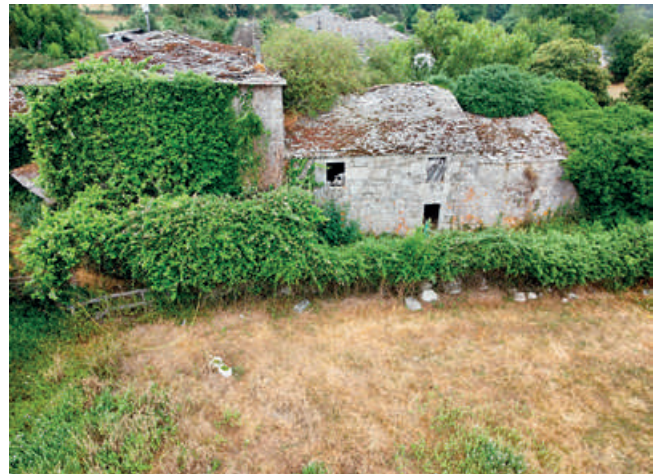
Fachada sur do pazo torre na vila da Póboa de Adai (Santiago de Adai-O Corgo).