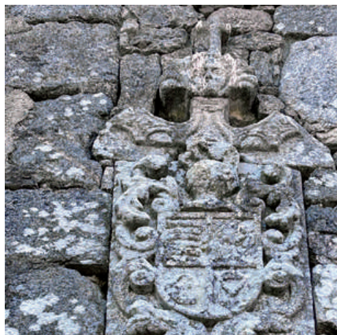
Foto del escudo de la casa de Hospital