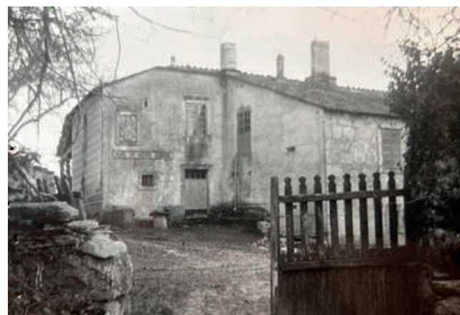
Outra parte da fachada oeste da casa de Santa Mariña de Cabreiros (foto da década dos anos 70 do século XX)