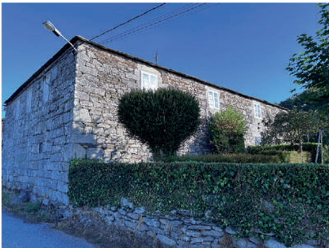
Foto Casa en Hospital dos Neira e Páramo