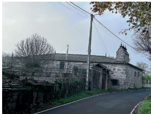
Foto casa grande en Vilagamelle, Santa Mariña de Cabreiros