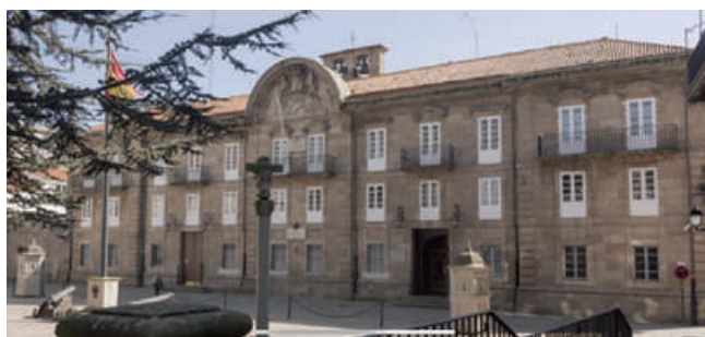
Capitanía e Real Audiencia do reino de Galicia en A Coruña (hoxe Capitanía Xeneral)

Á vista disto, podemos entender, por analoxía, que a querela de forza, á que se refire o preito que analizamos, era unha acción procesual