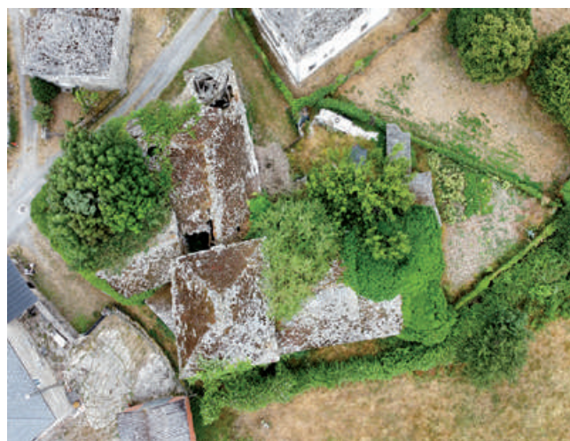
Foto cenital do pazo torre na vila da Póboa de Adai (Santiago de Adai-O Corgo).

Coruña, a septiembre quatro de setecientos zinco. // Ante mi, Oreiro