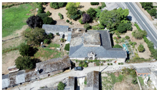
Vista cenital do pazo do Corgo de don Juan Valcarce Neira e Osorio

A súa casa, cun alto, mide 12 varas de fronte por 8 de fondo, ademais ten outra de dimensións algo inferiores: 8 de fronte por 6 de fondo. Todo isto fainos pensar que o actual pazo do Corgo debeu de ser ampliado 45 ou edificado en datas posteriores ao Catastro de Ensenada. Declarou 52 partidas, incluíndo as súas casas. Na freguesía do Corgo percibe de varios veciños 39 ferrados de centeo;