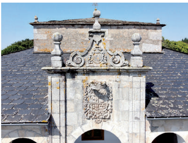
Pazo do Corgo dos Valcárce.