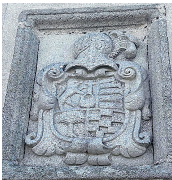
Escudo na casa de Ulloa en San Miguel de Pedrafita

Entre os xuíces da xurisdición atopamos algúns deles que obteñen rendas por antiga observancia ou por foro: é o caso de don Thomás Teijeiro, veciño do pobo de Pedrafita, na parroquia de San Miguel do mesmo nome, onde residía nunha casa de boas dimensións, 18 varas de fronte por 10 de fondo, ao que lle regulan de aluguer 24 reais de vellón anual, posiblemente a que hoxe en día se coñece por casa de Ulloa. No momento da súa