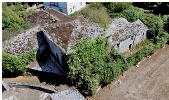
Vista aérea da fachada oeste do pazo-torre na Vila da Póboa de Adai (Santiago de Adai-O Corgo).

A confirmación do que dicimos atopámola no seguinte testemuño que un xuíz ordinario de Adai realizou o 8 de xaneiro de 1775: Francisco Antonio de la Vega y Montenegro, Juez y Justicia hordinaria en la Villa y Puebla de Aday, y cotos a ella unidos, que como tal conoce en el de San Fiz de Paradela en lo civil; en Pousada en lo real y criminal; en el de San Pedro de San Andrés de Chamoso a prebención; en el de Baldomiro en lo civil y criminal; en Santa María de Moreira