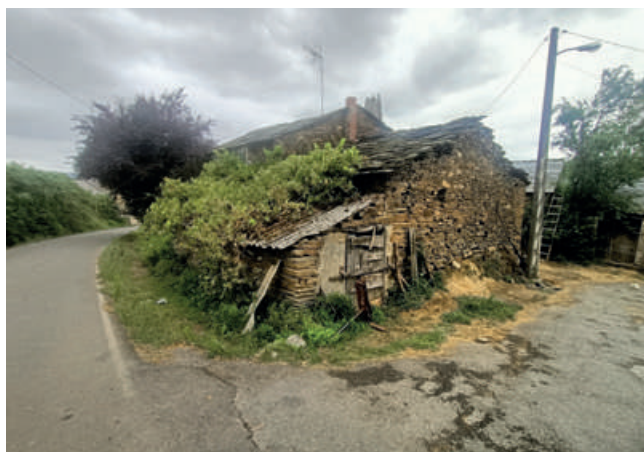
Casa Leirado de Vilar