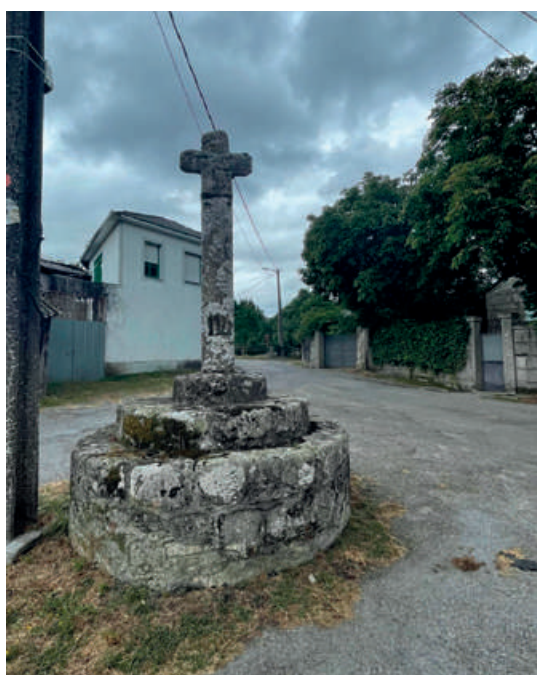
Cruceiro de Hospital de Chamoso