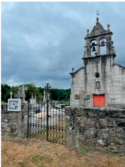
Entrada á igrexa de Santo André de Chamoso