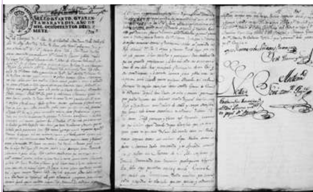
SELLO CUARTO, QUARENTA MARAVEDÍS, AÑO DE MIL OCHOCIENTOS DIEZ Y SIETE En la parroquia de San Pedro de Paradela,