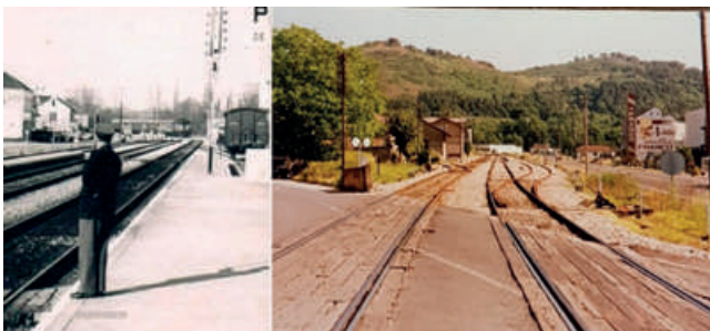
Fotos antigas da estación da Pobra de San Xiao

A pesar de que non pertence ao concello, a outra estación relevante pola súa proximidade e influencia é a estación da Pobra de San Xiao. A estación constaba tamén dun edificio de base rectangular con dúas alturas, dúas plataformas, almacén e depósito de auga. O escritor barcelonés