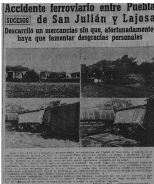
Noticia El Progreso 5-10-1956

Uns anos máis tarde, no mediodía do 4 de outubro de 1956, o tren de mercadorías CH-4 descarrilou en Maceda, no barrio de Vilariño, no punto onde a liña procedente de Laxosa xiraba a esquerda