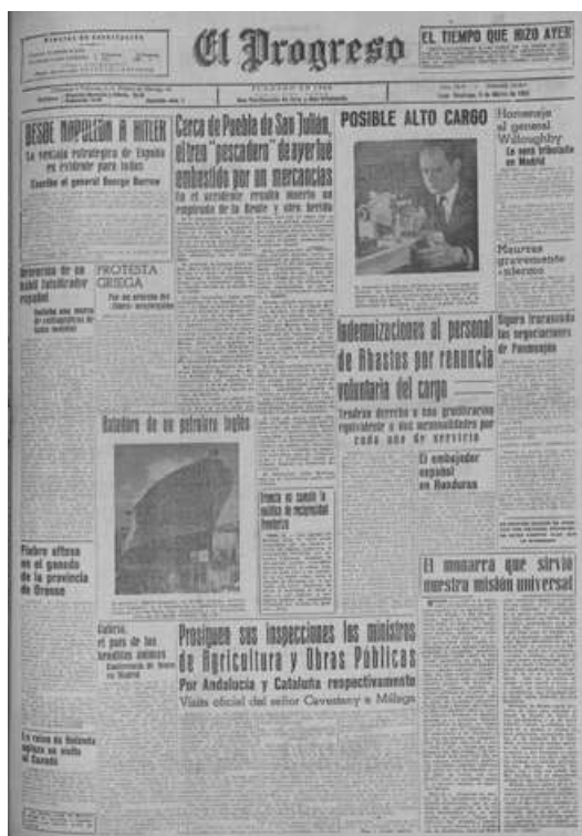
Portada el Progreso 9-3-1952

O tren especial de mercadorías tamén fixo a súa parada regulamentaria en Laxosa e déuselle saída para A Pobra de San Xiao xa que o persoal non recibiu ningunha nova da incidencia. Cando o tren de mercadorías chegaba a Sabarei, o seu persoal non viu as luces traseiras nin escoitou os sinais detonantes que se lle fixeron, producindo un violentísimo choque.