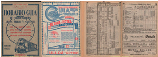
Exemplo de horarios entre A Coruña e Madrid nos anos 50

Moitos foron os trens que quedaron na memoria popular das xentes do Corgo.