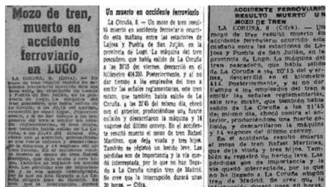
Otras portadas 9-3-1952

O suceso foi nova de portada no día seguinte non solo no Progreso de Lugo ou O Correo Galego, pero tamén en diferentes xornais do estado como o ABC ou La Vanguardia Española.