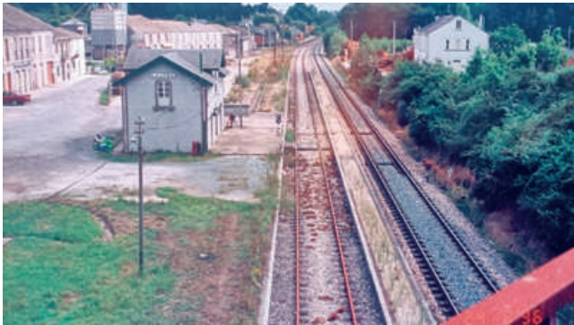
Estación Laxosa (1996)

A estación chegou a ser a terceira en exportación –despois de Lugo e de Monforte- e a sétima en importación entre as dezaseis establecidas na provincia de Lugo. Sábese que no ano 1912, por esta estación chegaron a exportarse 565 cabezas de gando vacún.