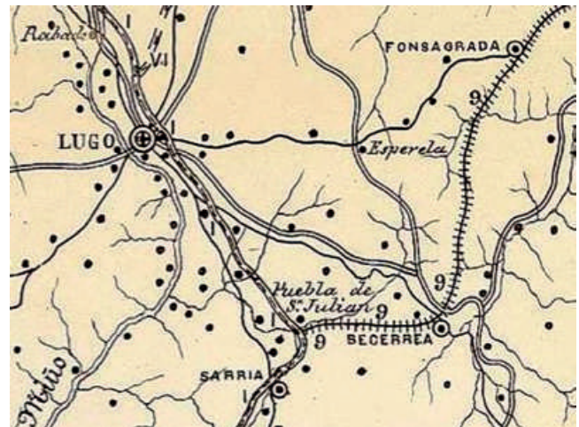
Detalle da rede de ferrocarrís secundarios proposta pola 'Sociedad Económica de Amigos del País de Santiago'.

Non podemos finalizar este pequeno recorrido polas vías e estacións, sen lembrar o plan que definiu, a finais do século XIX, a Sociedad Económica de amigos del país para construír unha nova liña férrea secundaria de 85Km que unise