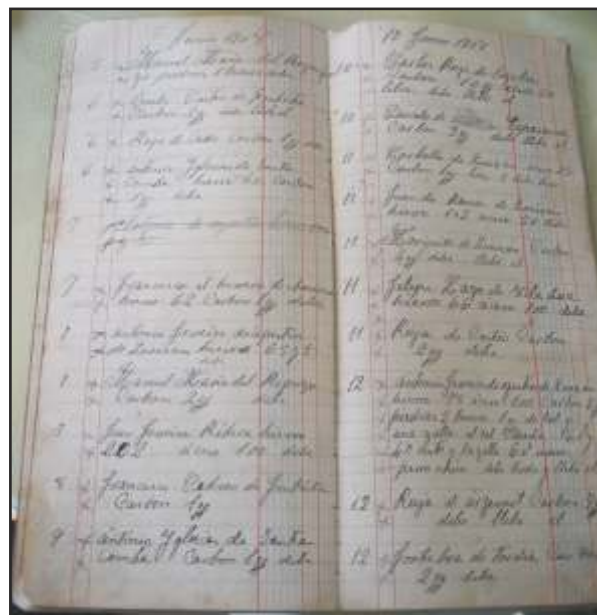
Libro de contas do 10 de Xuño de 1908

ultramarcinos, viño, sacos de cereais, fariña... Recorda Antonio Ferreiro o caso dun ferreiro do mazo que casou dúas fillas e comentaba: " Non me vai chegar a fouciñada para pagar a voda ". Non se pagaba ata setembro porque os fouciños non eran cobrados ata agosto.