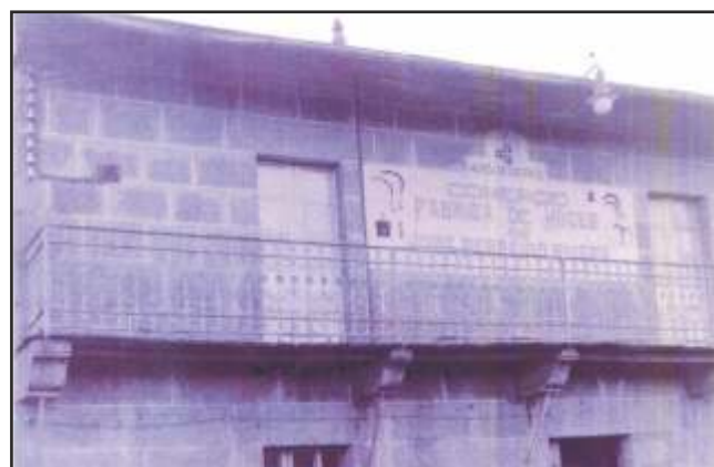
Foto de época da casa e tenda en Laxosa

Foi unha familia, dende logo, moi importante e influente na súa época, e contaba todo o ano