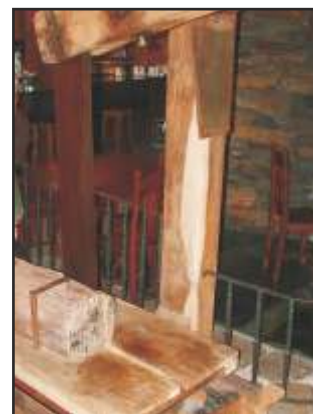
Detalle da serra

Está situado no río Chamoso, no lugar de Santa Comba, nas proximidades da cidade de Lugo, e constitúe un complexo de grande importancia arqueolóxica e industrial na que a forza da auga, mediante un sistema arquitectónico máis que enxeñoso de canalizacións, imprime forza no mazo, na serra, na moa de afiar e no muíño. Todos estes aparellos dan conta do aproveitamento dos recursos e das múltiples actividades que alí se foron desenvolvendo.