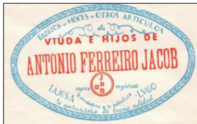
Insignia dos últimos propietarios da empresa