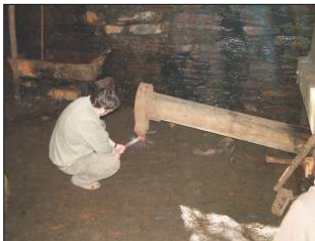
Demostración do funcionamento do mazo na actualidade