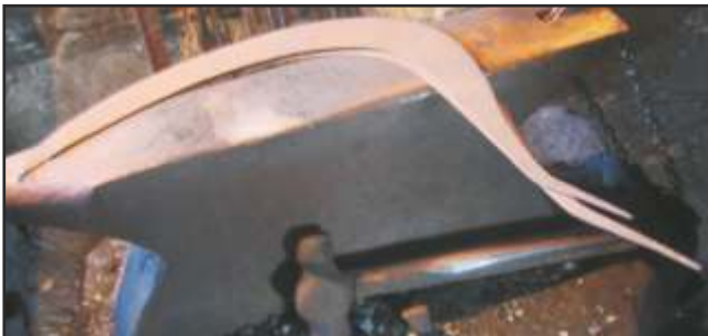
Modelo anca, o terciado e o grande