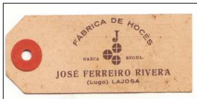
Etiqueta dos fouciños coa marca rexistrada