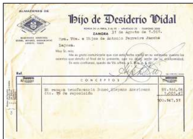
Recibo da chegada da remesa á ferraxería de Hijo de Desiderio Vidal

Chegarónse a vender entre 50.000 e 60.000 fouchiños nunha campaña para Castela, pola demanda relacionada coa sega do trigo, datos segundo recordan os ferreiros que alí traballaron. Constatados nos libros de contas da época que se conservan e aos que tivemos acceso no ano 1953 facturáronse un total de arredor de 25.000 fouchiños coa marca rexistrada, anos nos que o negocio non era o que fora nos seus mellores tempos 4 .