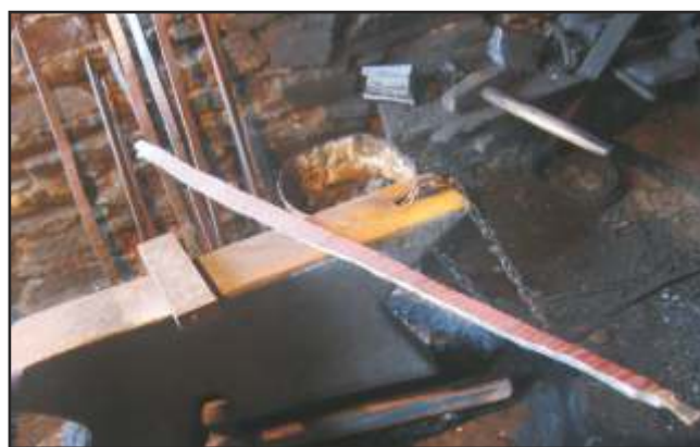
Detalle das varillas