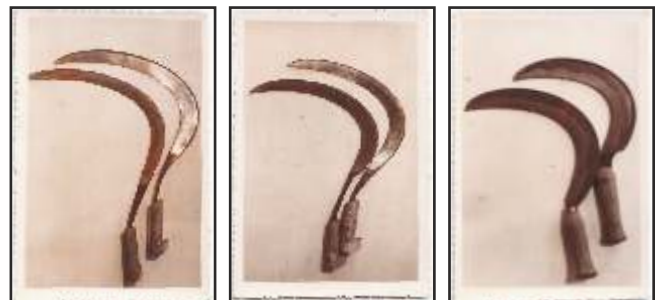
Varias fotografías de época, mostra da variedade de fociños ofertados

De cada un destes modelos, existía o tamaño grande e o terciado. E mesmo cada un destes modelos tiña utilidades distintas, pero principalmente eran empregados para o trigo e o centeo.