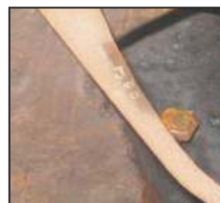
Detalle da marca Jota Tres Estrellas nun fouciño da época

Tamén derivada da actividade que se levaba a cabo no mazo se fabricaban outra gama de fouciños sen marca, que levaban un aceiro de menor calidade, e polo tanto outro prezo asociado, mentres que os de marca levaban aceiro de primeira calidade, de marcas Bellota e Heva. A capacidade do aceiro para adelgazar e estirarse era que facía destas dúas marcas unhas das mellores, posto que as de menor calidade, cuarteábanse máis facilmente.