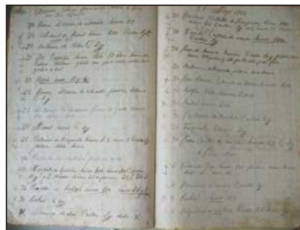
Caderno de notas do 31 de Maio de 1910