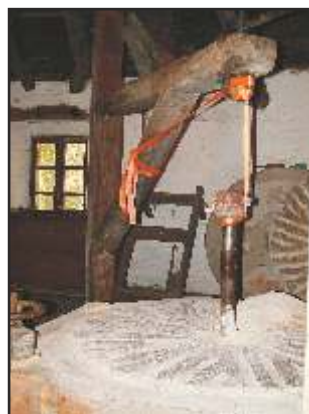
Detalle do muíño