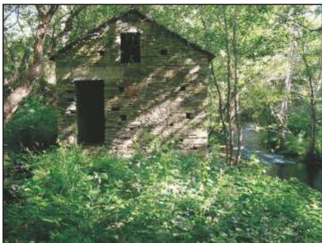
Moas da Caxigueira

rodicios e á súa vez dúas moas por rodicio. Ó paso polas proximidades destas foi construído no río unha presa para conducir as augas ata elas e evitar que nos meses de verán o baixo caudal do río non impedise o afiado. Tamén nas proximidades do mazo se atopaban as moas da Arca, as da Foz e as da Labrada, hoxe todas elas desaparecidas.