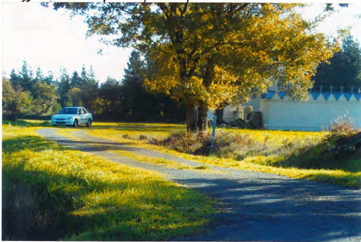
F54. Acces a la Iglesia de Sabarey