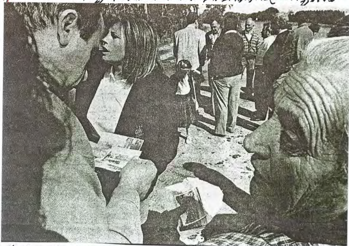
F 70. Reunión de los vecinos de Corgo, el 17 septiembre 1994 para delimitar la antigua plaza de la parroquia

De conformidad con el informe emitido por la Comisión de Pías, Obras y Servicios Públicos, por unanimidad se acordó proceder a la delimitación de las majanetas que delimitan la "Plaza de Corgo", ubicada entre la carretera S-VI y el ca-