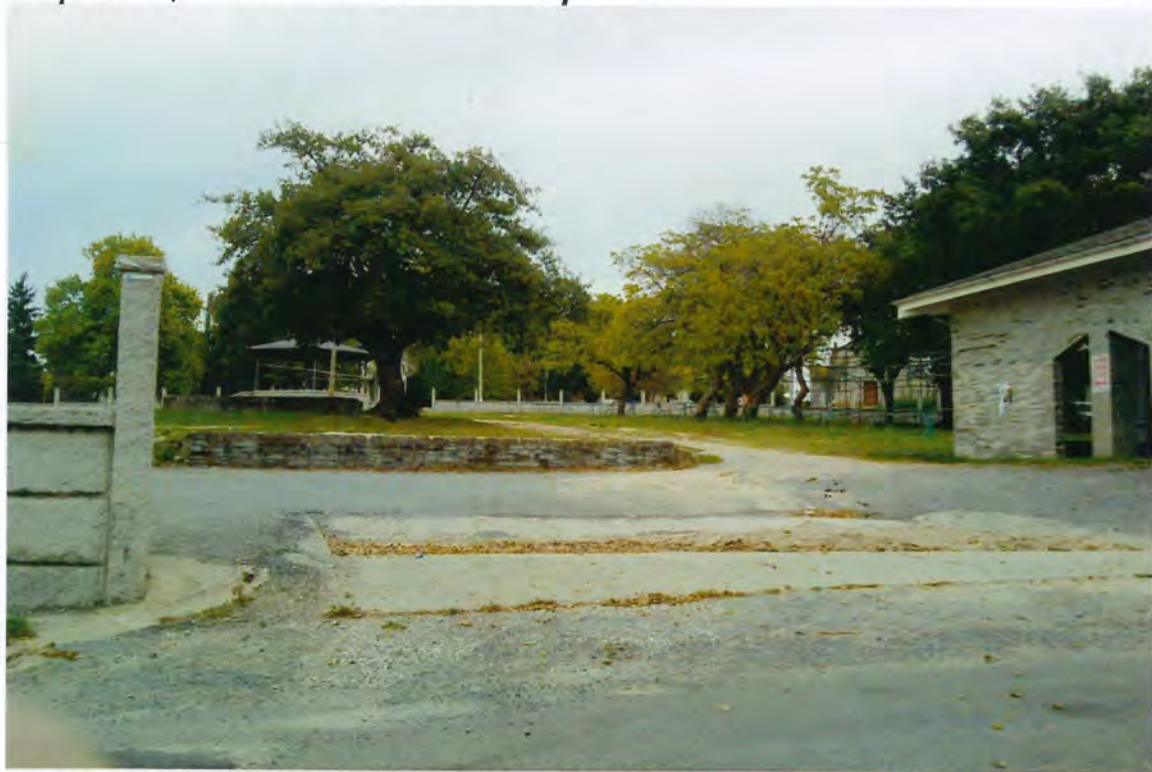
F 29- Campo de la Feria de Aday

Otra a la Conselleria de Agricultura, Ganadería e Montes, con destino a la Feria Exposición de Haza Rubia Galega, que se celebró en Aday, el trece de Abril con un presupuesto de 1.875.000 ptas.