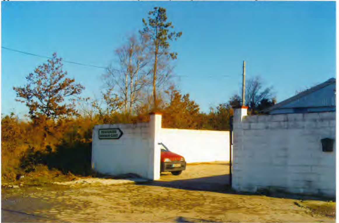
F57- Nave de Herranz