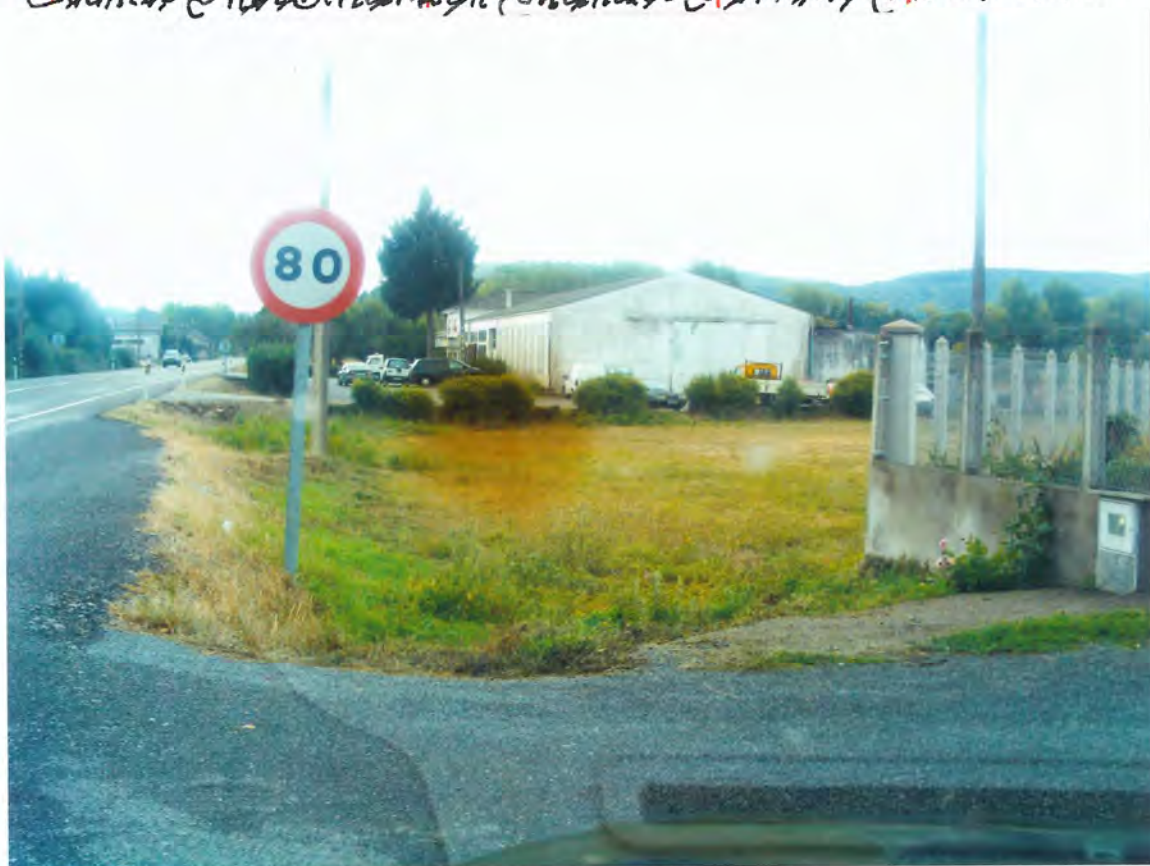
F 37. Taller de automóviles, en Escourada