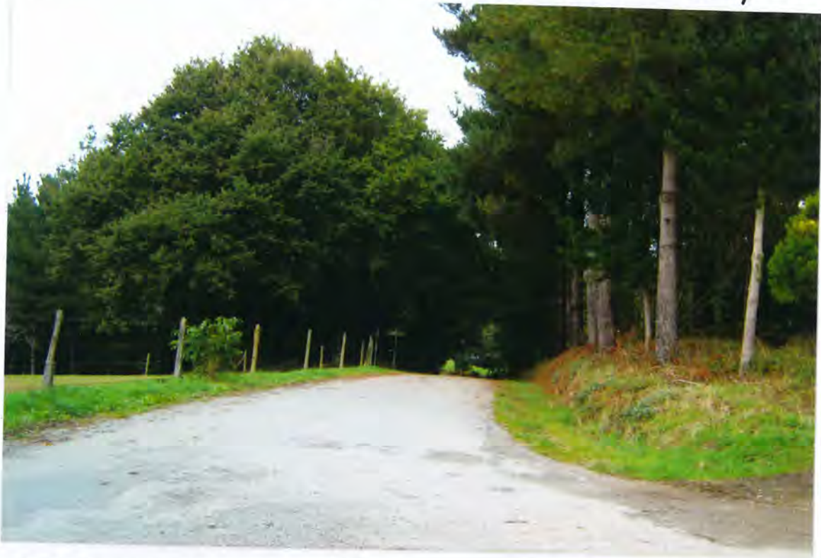
F 18 - Camino de Fental a Quinte

La Corporación por unanimidad acordó adjudicar provisionalmente dicha obra al citado contratista por $ 500.000 ptas.