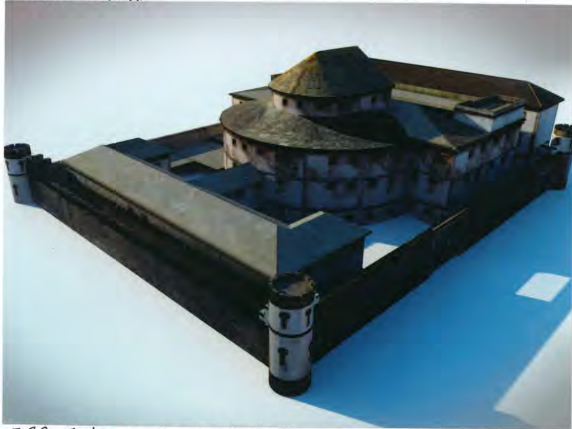
F69. Antigua carcel de Lugo

Por el Sr. Alcalde, se informó de la entrega del edificio de la antigua "Carcel de Lugo", realizada por el Estado, y aceptada por las Ayuntamientoas que componían el Partido Judicial de Lugo, entre las que se encontraba este de Carra.