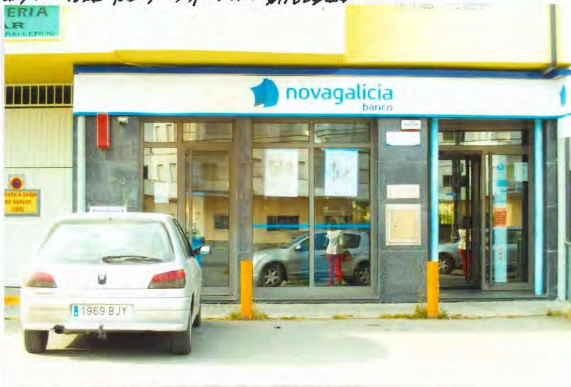
F 25 - Caja de Ahorros de Cargo