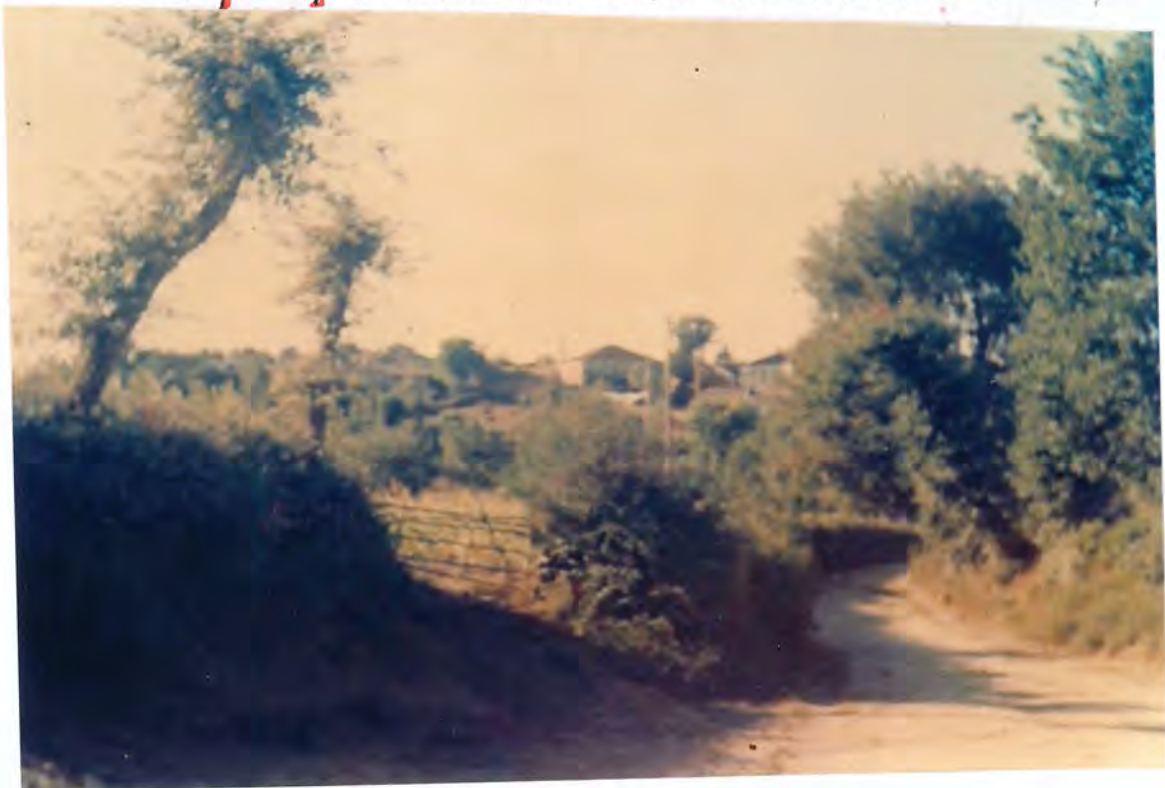
F10. Camino antiguo de Santa Eufemia

Aprobar la propuesta de obras de este Ayuntamiento a incluir en el Plan Provincial de 1.990, antes relacionada