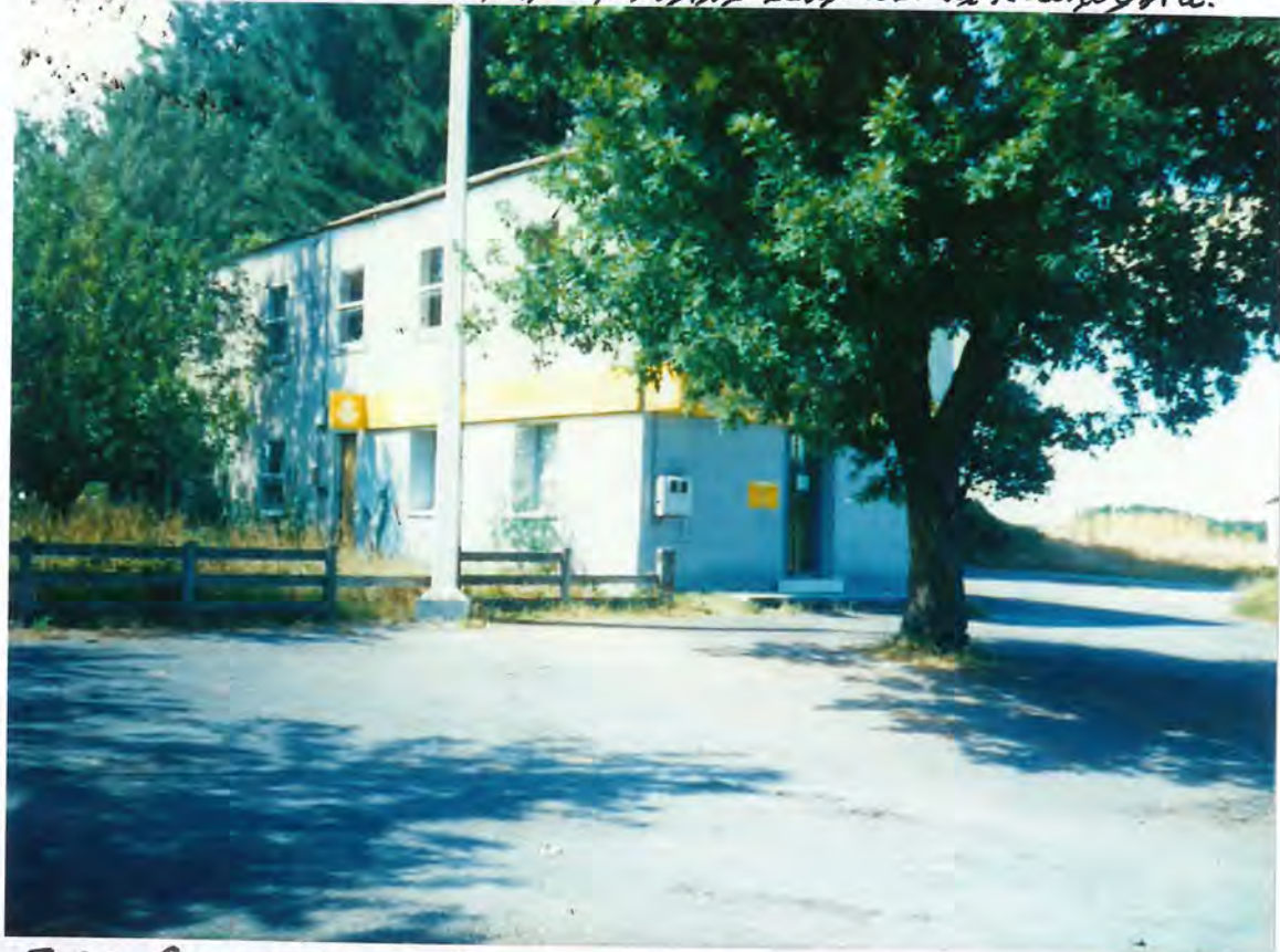
F. 68. Correos, antigua escuela de Corgo.

La Comisión de Gobierno acordó autorizar la citada obra.