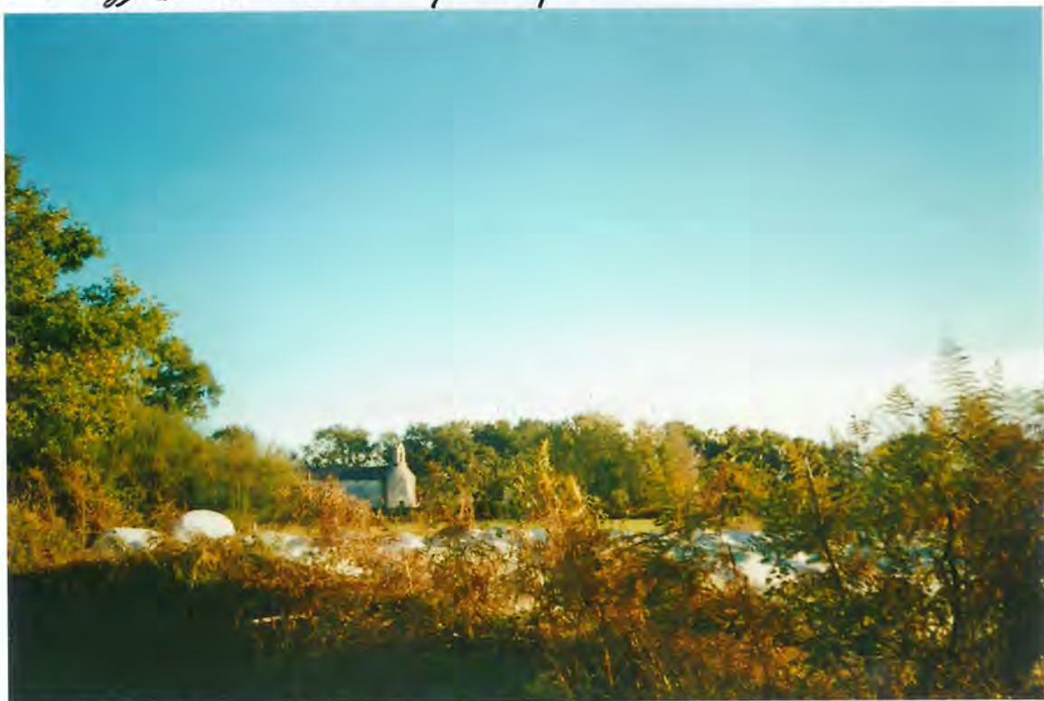
F 44. Camino de Santiz de Berguzo, al fondo la Iglesia parroquial.