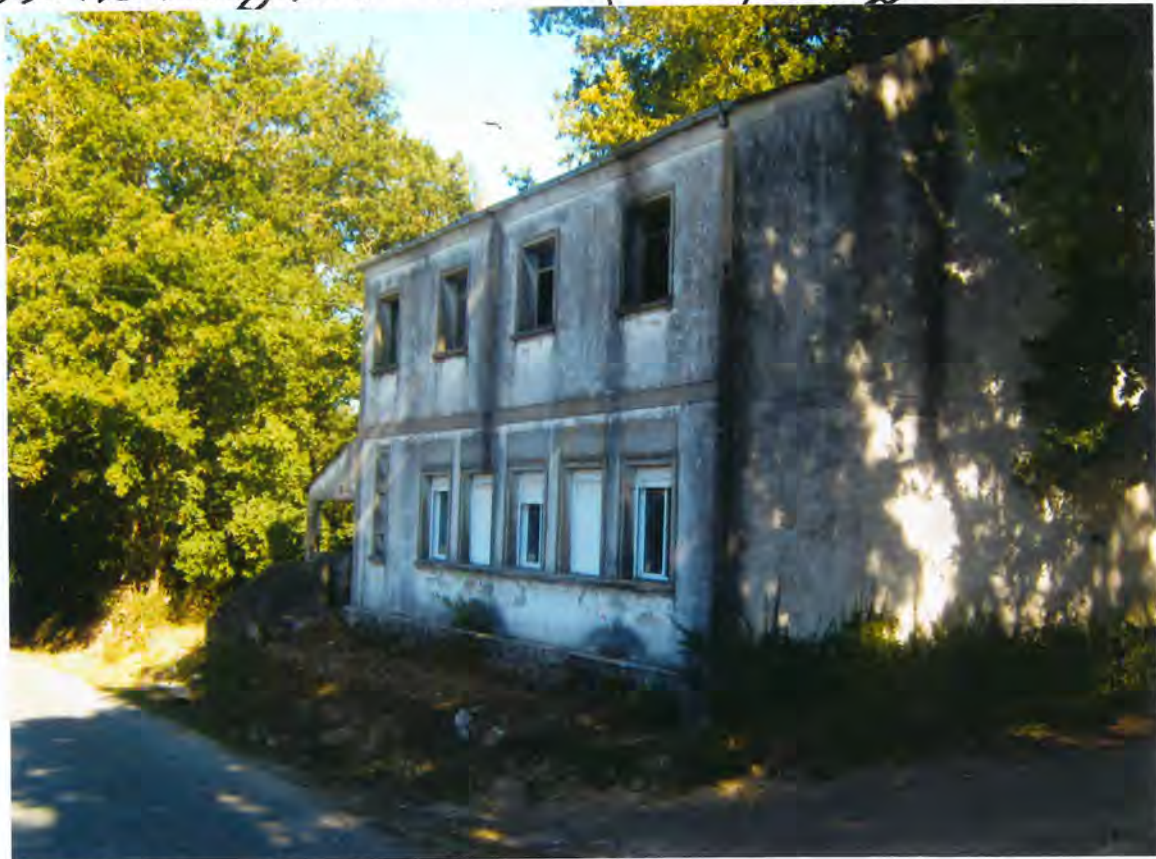
F. 45. Escuela de Franqueán.

En sesión ordinaria del Pleno del día veintinueve de Julio y visto el escrito nº 3538 de 23-V-93, del Ilmo. Sr. Director General de Suventud, de la Conselleria de Cultura y Suventud, que contenía la resolución del expediente tramitado por la que concede a este Ayuntamiento una subvención de 1.000.000 ptas con destino a reforma y equipamiento de los edificios en los que radicaban las antiguas escuelas de Franqueán y Cercós.