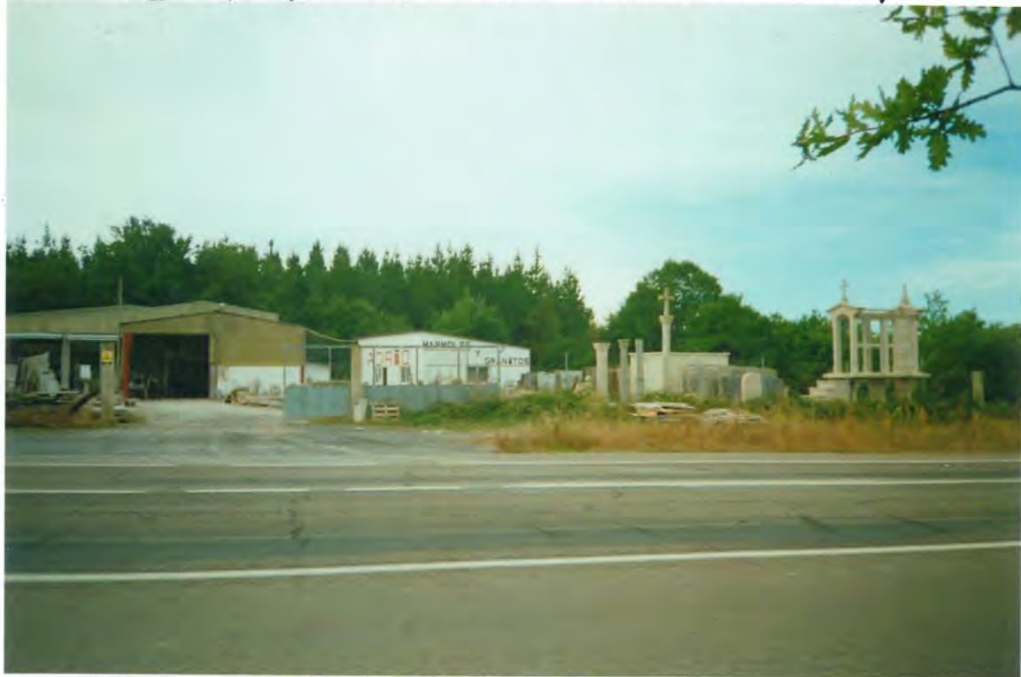
F. 36 - Mármoles Adrio - Taller artesanal en piedra