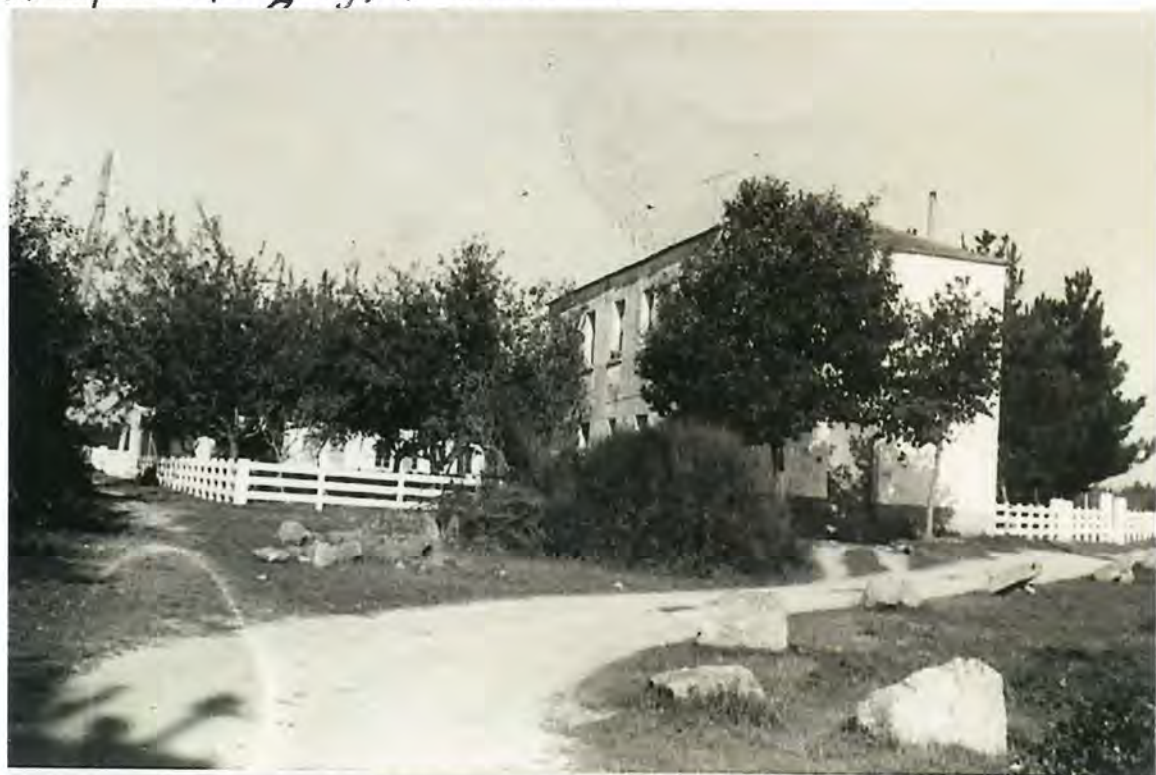
F. 51. Escuela antigua de Corgo

un local del bajo del edificio de las antiguas viviendas de los maestros de Corgo, una vez realizadas las obras de reparación y mejora del mismo.