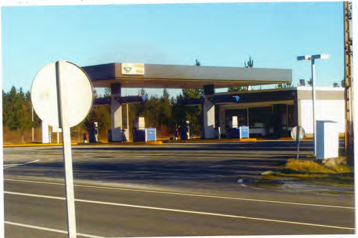
F.13. Estación de Servicio de Sabarey