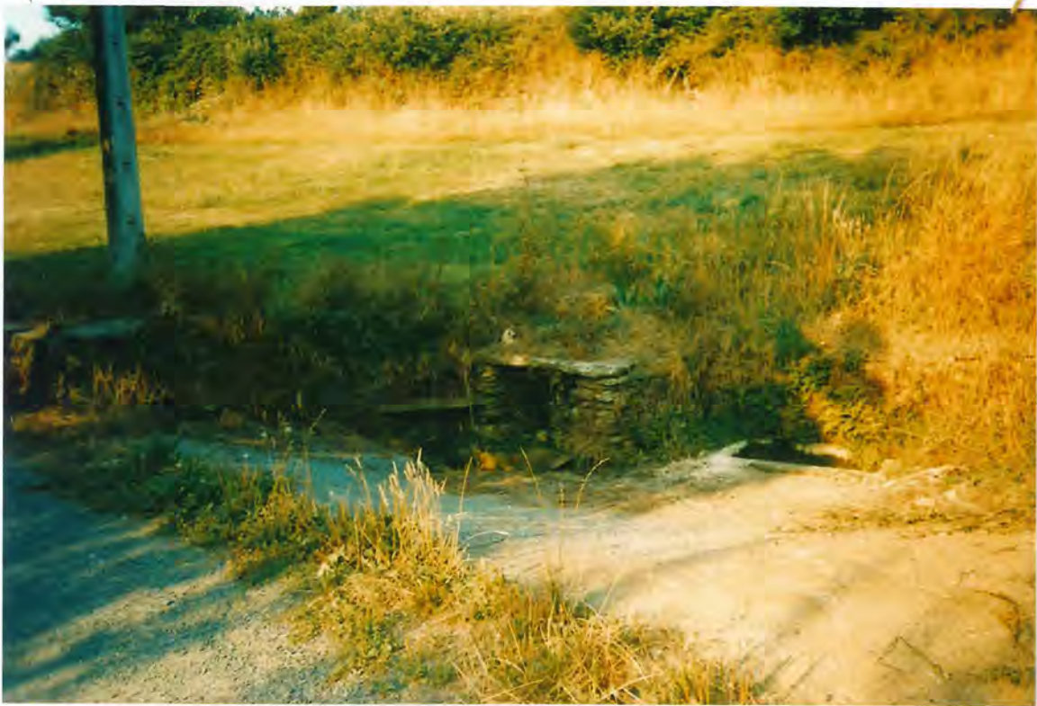
F. 14 Fuente do Pacio, en Quinte