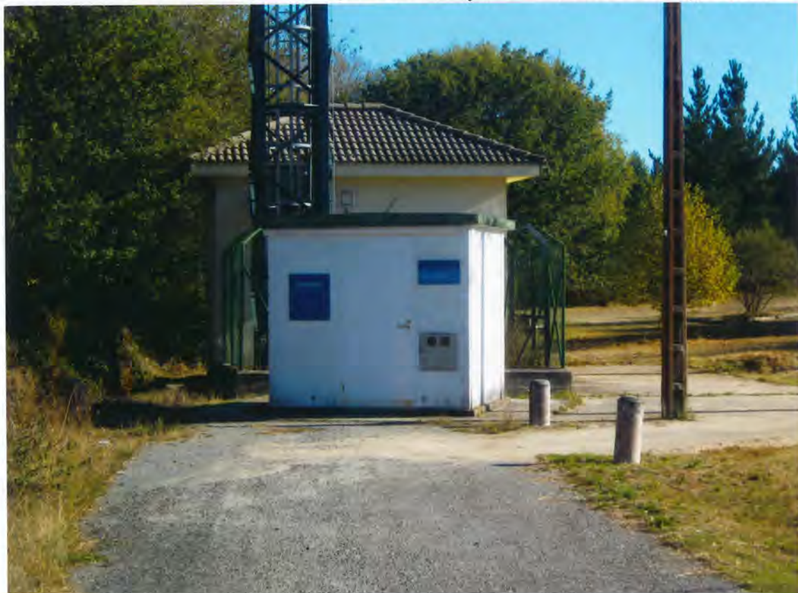
P 32 - Central de Abonados de Telefonos