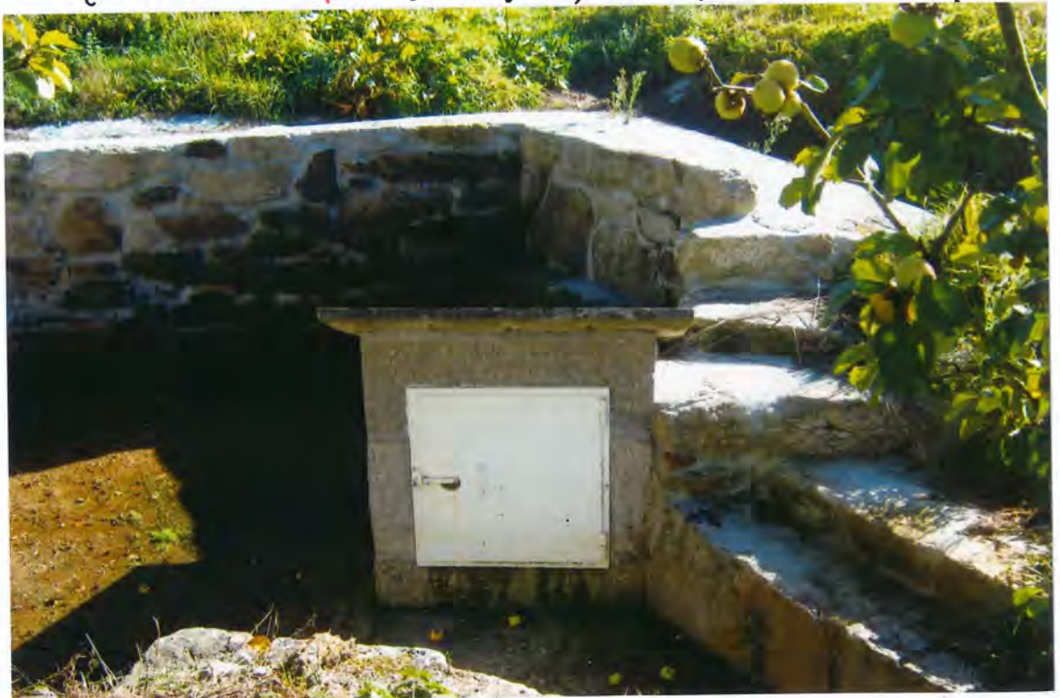
F. 67. Fuente pública en Franquedú.