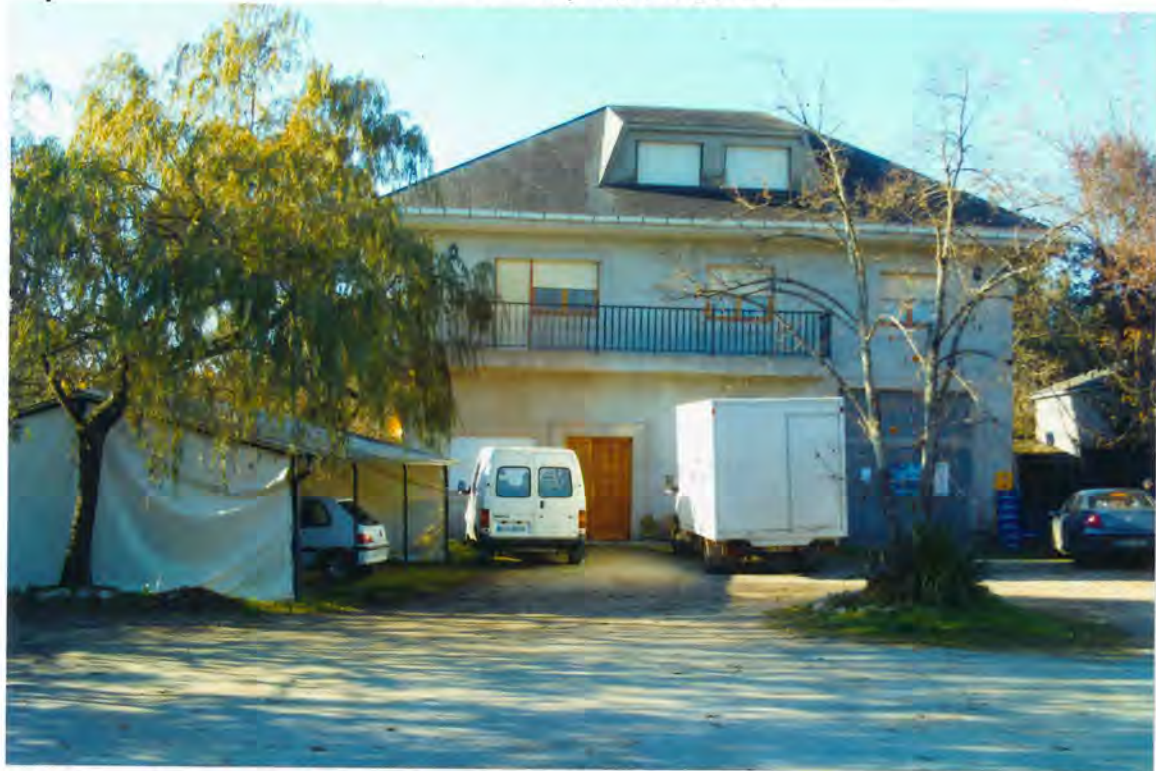
F. 72 - Casa-bar de Eloy Lopea Díaz, en Fonteita

mente dedicada al comercio de por menor de toda clase de artículos, pasando a dedicarse en la sucesivo, a café-bar, para lo que ya se ha dado de alta en el impuesto de actividades económicas.