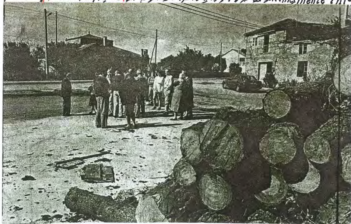
F 50. Reunión de los vecinos de Cargo, el 17 Septiembre 1994 para delimitar la antigua plaza de la parroquia

En sesión extraordinaria del pleno del día siete de Septiembre y a propuesta del Sr. Alcalde y de conformidad con el dictamen de la Comisión de Ptas, Obras y Servicios públicos, la Corporación acordó unánimemente ni-