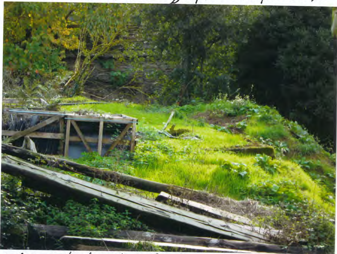
F21-Depósito de purín en Cuinte

silencio administrativo de este Ayuntamiento a un escrito del recurrente sobre petición de que se paralizara la actividad de conducción y depósito de purín, con