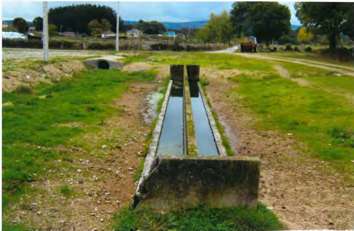
F12-lavadero en Lapio.

A propuesta de la Presidencia, por unanimidad se acordó construir un lavadero municipal, en Lapio, con un presupuesto de 250.000 ptas.