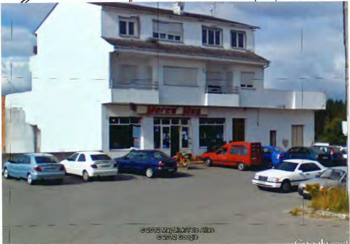
F.73 Supermercado Merca - Mas

Por traslado del expediente a la Comisión Provincial del Medio Ambiente de la Consejería de la Presidencia y Administración Pública, a los efectos que procedieran