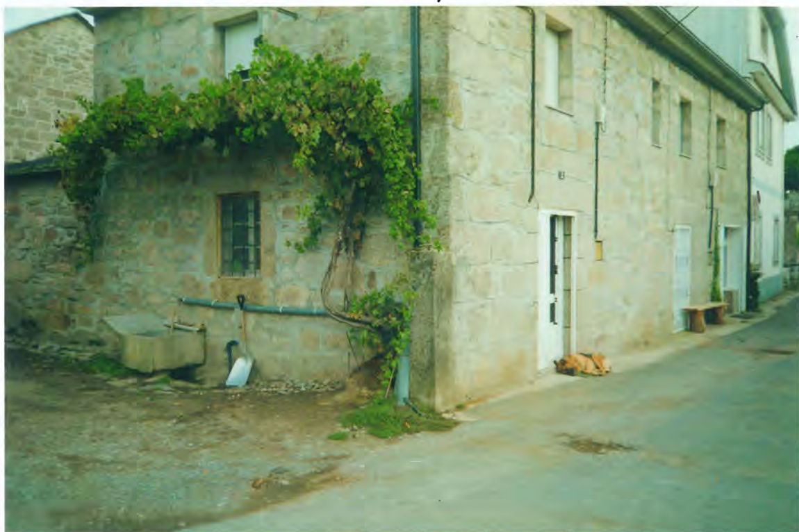
F19- Carnicería Crecente