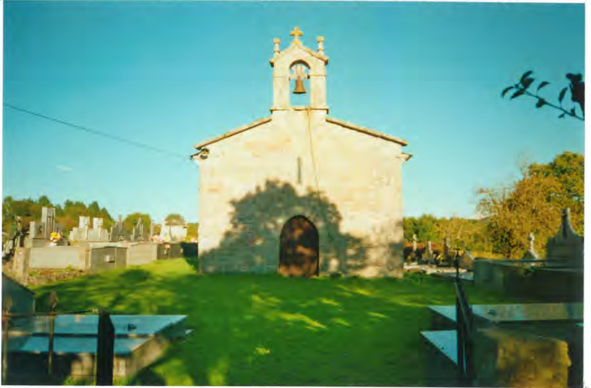
F17- Iglesia de Campelo