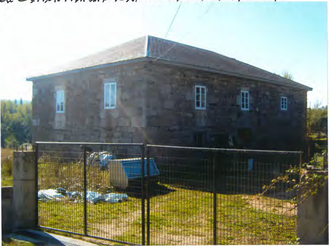
F47. Casa Torcón, en comedán.