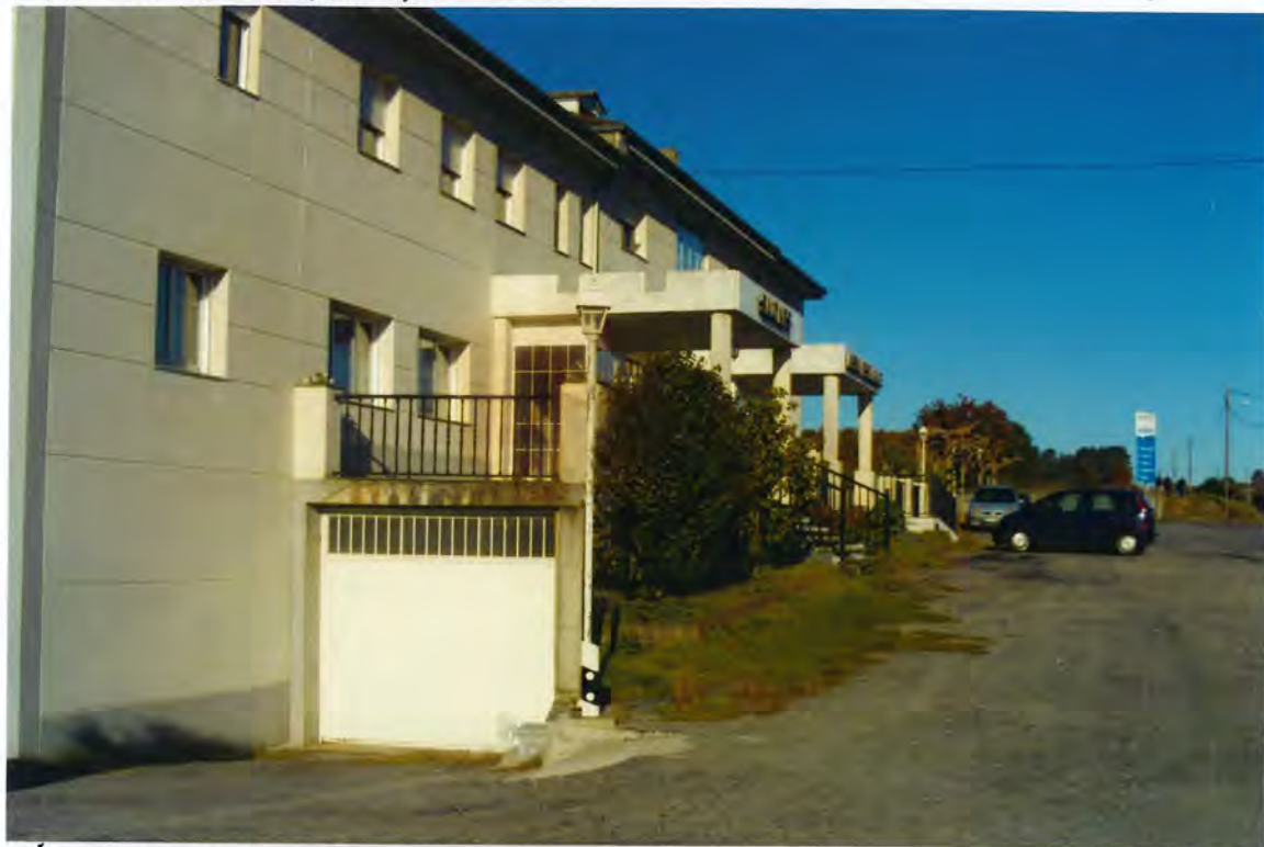
F23-Hostal Alborada, en San Cosme de Marán

lar una campana extractora de humos en la cocina de su establecimiento.