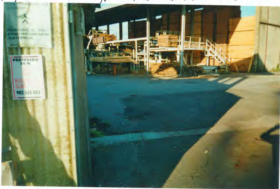
F5. Nave para la transformación de la madera