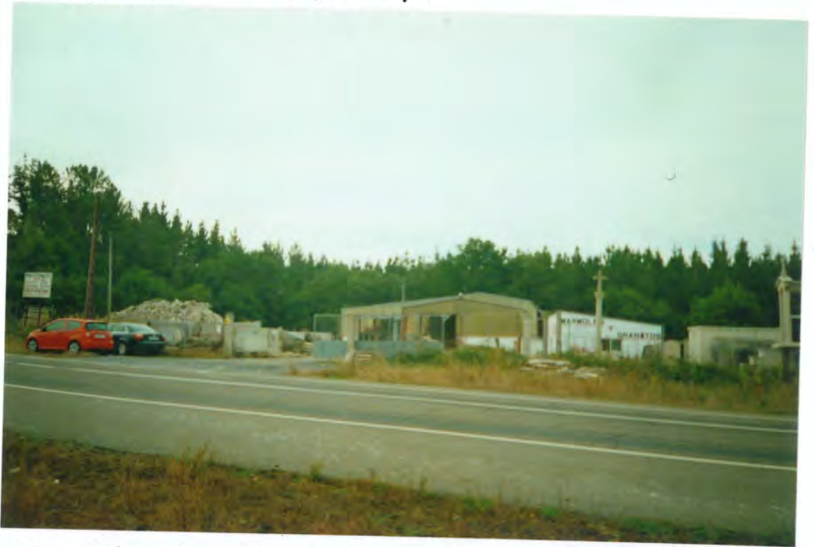
F.43- Marmoles Adrio. Taller artesanal en piedra