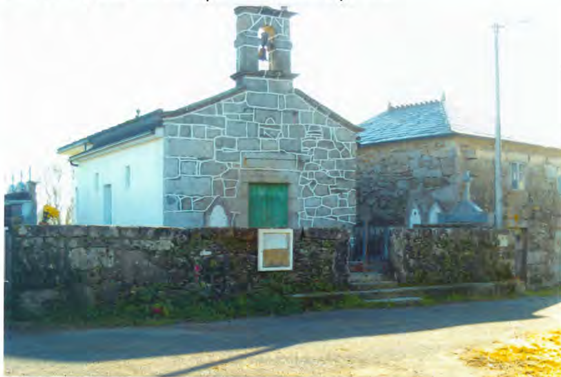
F. 35. Plaza de la Iglesia en San Cosme de Manán

La Santa Parroquia de San Cosme de Manán, solicitó ayuda al Ayuntamiento, concretamente en tres camiones de zahorra y uno de arena, para realizar obras en la Plaza de la Iglesia de aquella parroquia