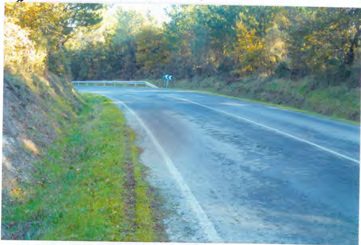
F 61- Carretera 23- en Fonteita

a partir de donde continúa con la denominación de camino de servicio C-2. Que las obras de construcción de la referida vía fueran contratadas por S. R. y D. A. antes de su transferencia a la Junta de Galicia y ejecutadas por la empresa C. R. y D. I. G. N. S. R. sin que fueran recibidas por este Ayuntamiento, según acuerdo plenario de 4-VI-92 en el que asimismo se acordó formular "Recurso de Alzada" contra la resolución de la Dirección General de Estructuras y Desarrollo Agrario de 30-IV-92, por la que se acordaba la entrega a este Ayuntamiento de las citadas obras.