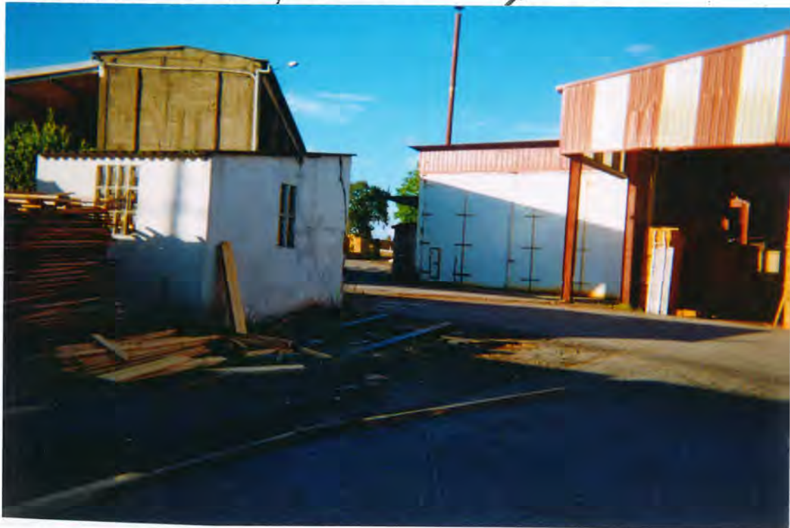
F4. Nave-almacen para secado de madera

almacén para secado de madera. La Comisión por unanimidad, acordó: 1º Informar favorablemente la concesión de licencia municipal solicitada y 2º Dar traslado del expediente completo a la Comisión Provincial de Medio Ambiente, a los efectos previstos en el Reglamento.