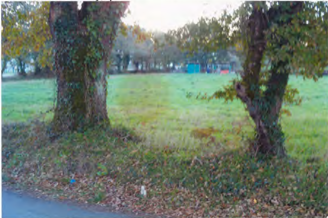
F3. Finca de Don Antonio Mosquera Candal

1º Construcción de cierre con bloques de cemento del frente de la finca que lindaba con la E-VI en una longitud de unos 100 m. y altura de 0'40 m. con valla metálica en su parte superior hasta alcanzar una altura de 1'800 m. con las correspondientes columnas y portales de entrada.