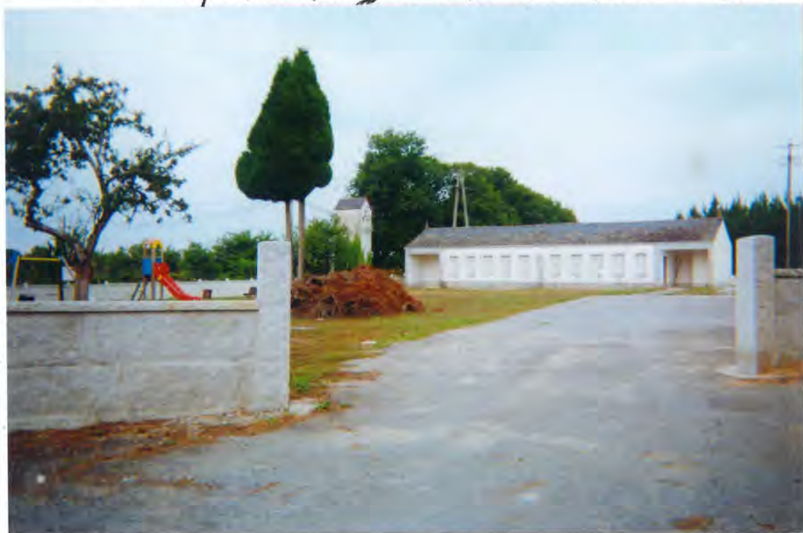
F.39 - La cal donde ultimamente se celebraba escuela.