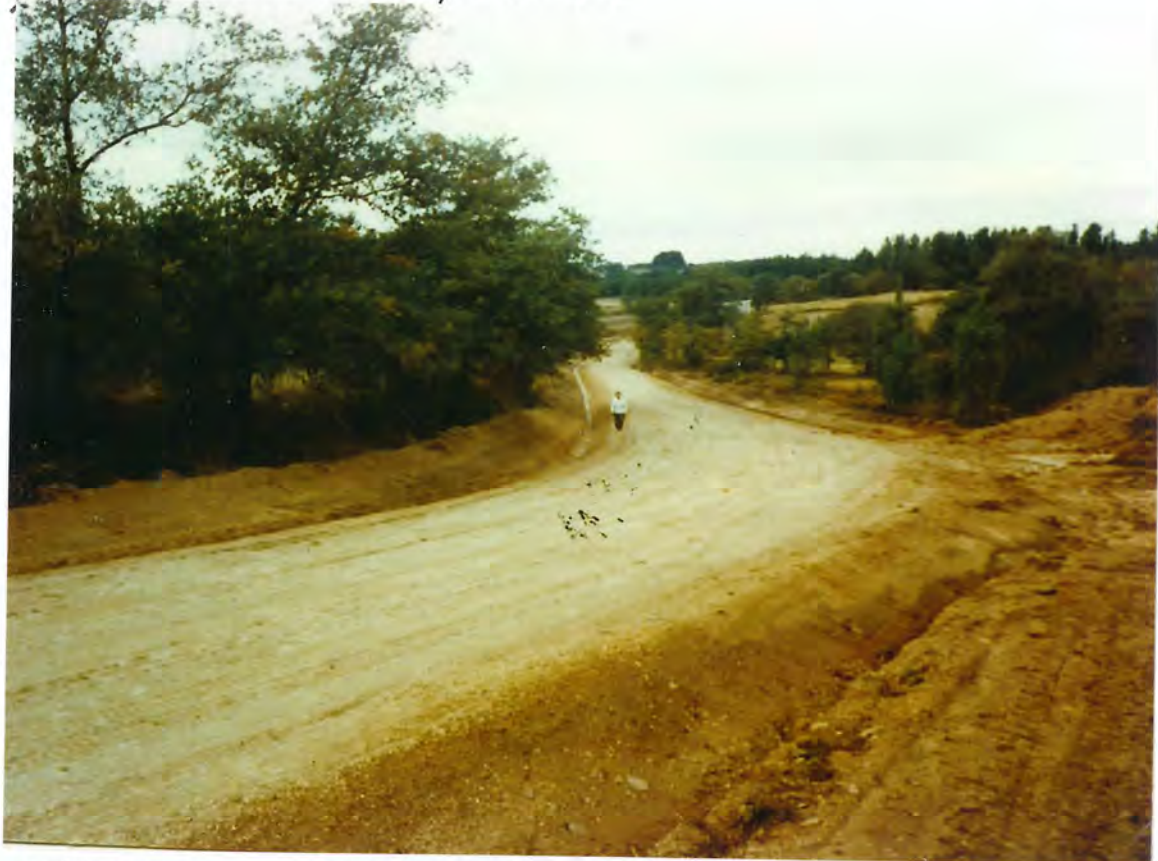
F 11- Obras en el camino antiguo de Santa Eufemia

aceptando la financiación de las obras del citado Plan y comprometiéndose a satisfacer las importes con cargo a este Ayuntamiento, encargando la confección de los respectivos proyectos a técnicos competentes.