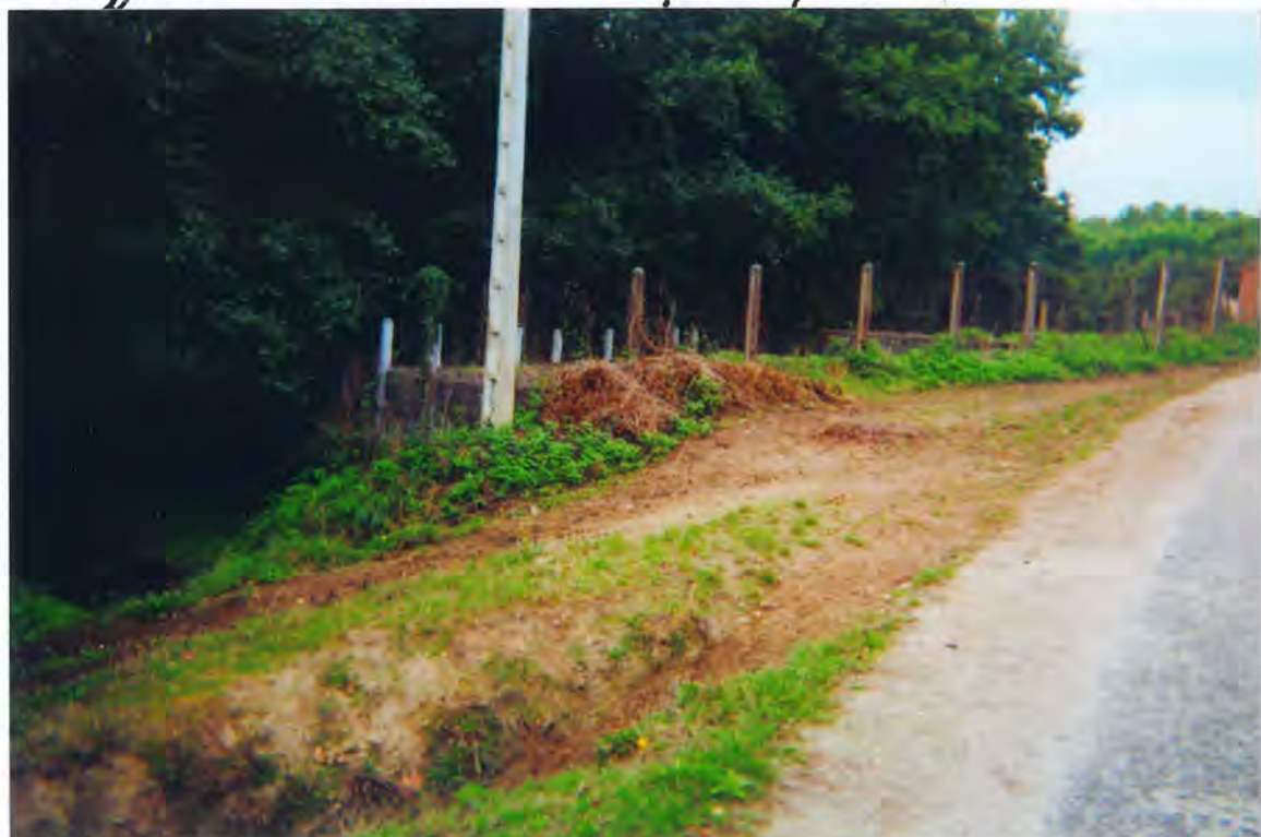
F 23. Depuradora en Corgo

2.º Ajudicar la obra de "Depuradora de l.ª de agua de Corgo" 1.ª fase a la misma empresa, por 2.422.550 ptas.