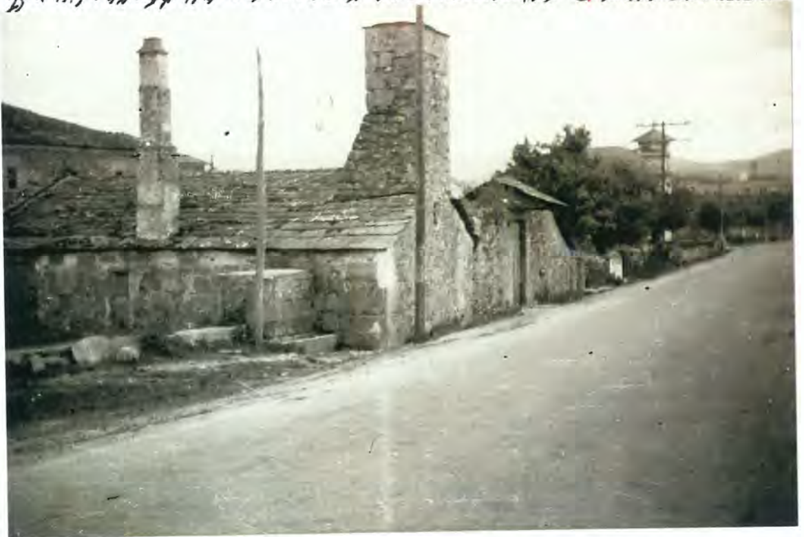
F. 31. - Lugar conhecido por "Plazuela" en Corgo

de Galiza, sendo a principal via de comunicaco da nova nao e tambm um dos espellos dela. Os visitantes podem observar as mltiplas aberraes urbanísticas, ja que na maioria das casas as construcces no se ajustam ao tipo local da zona por falta d'uma norma de respeito, tambm se pode ver a 150m. da casa do Cancello o lamentable estado em que se encontra unha plaza con- cida popularmente como "Plazuela", donde anteriormente havia unha fonte con valor histrico-artístico, sendo lu- gar de recreo de vecios e visitantes do C orad, rpre- n-