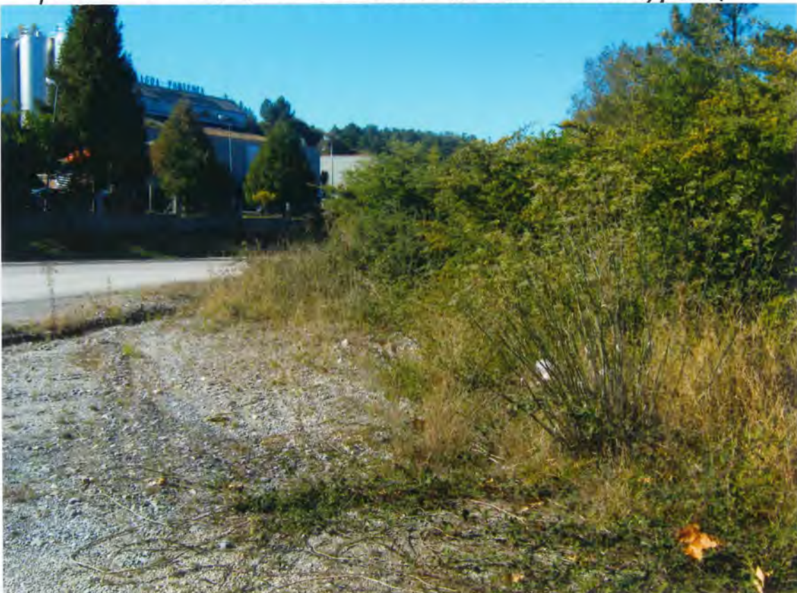
F9- Canal delimitando los municipios