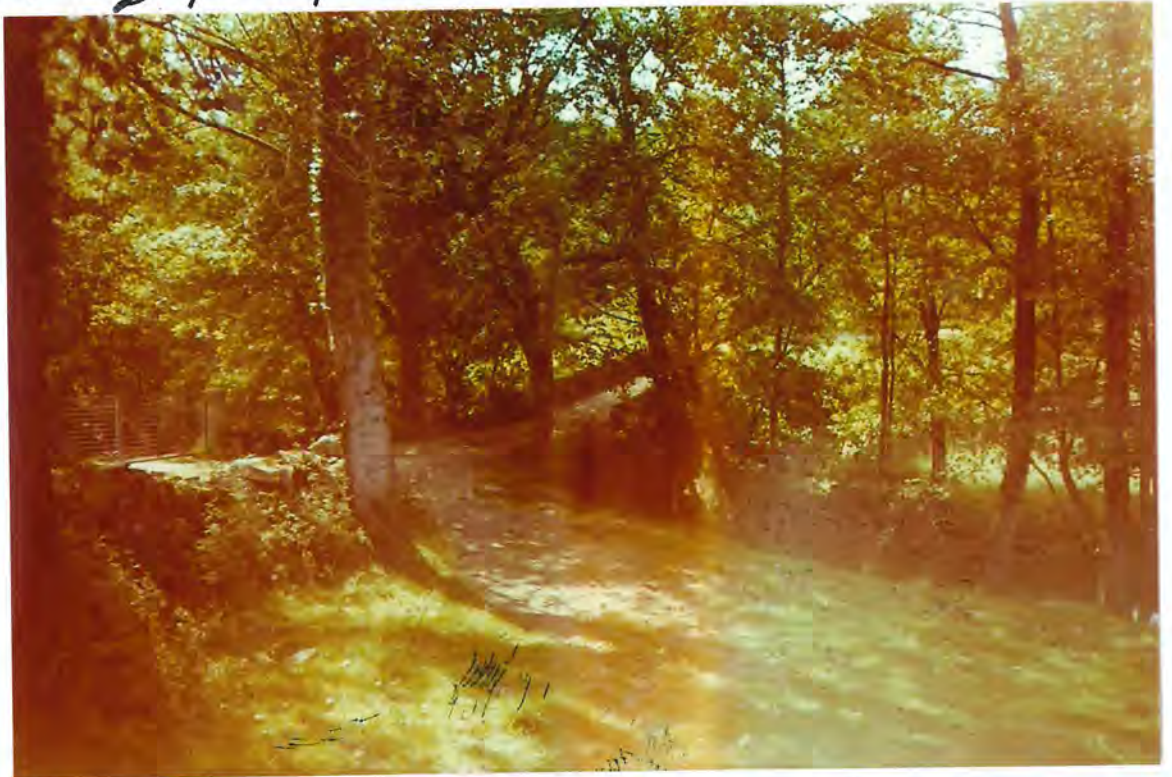
F 41- Puente romano en el Tordea

También se dio cuenta del escrito del citado Ayuntamiento de Alarcara , que comunicaba el acuerdo de aquella Corporación, de 1 de Diciembre de 1.992 , de solicitar de la Junta de Galicia que realizara las obras necesarias para acondicionar y rehabilitar el "Camino Real" que bituraba del "Camino de Santiago" en Santra (Tracastela) , siguiendo por el Ayuntamiento de Alarcara , pasando al de Carra por el puente romano sobre el río Carra .