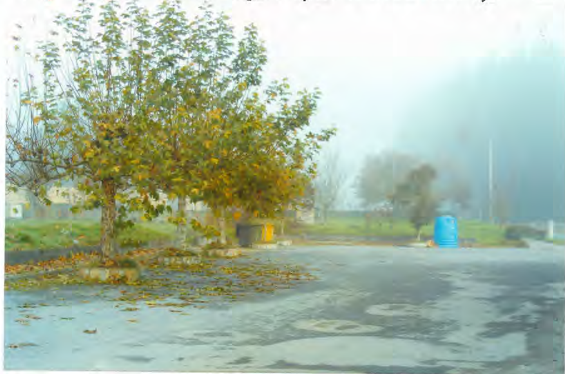
F 28 - Plaza del Ayuntamiento.

Otra a la "Cancelleria de Ordenación de Territorio y Obras Públicas", de 13.447.000, para construcción de una plaza pública de Orgo, al pie de la Casa Ayuntamiento