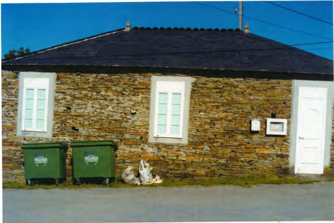
F.54. Escuela antigua de Lajosa

calles de 1.992, dentro del programa de pequeñas infraestructuras y equipamientos locales, las obras que se relacionan: