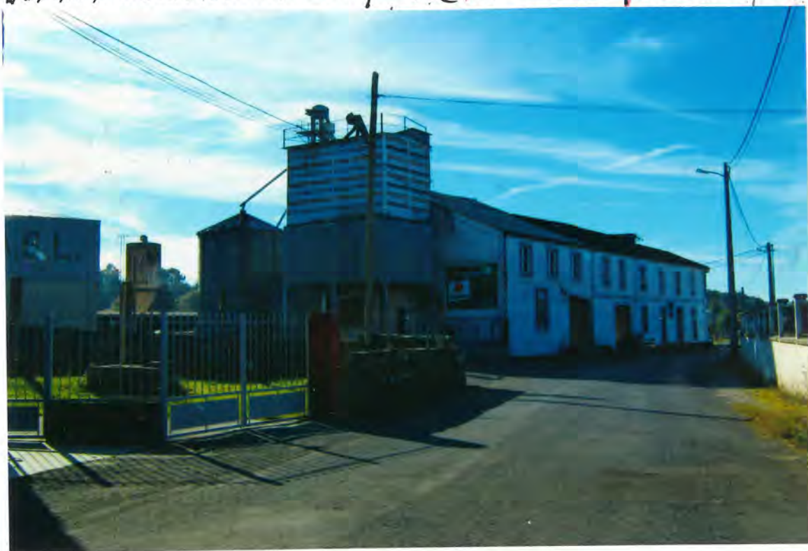
F25. Fábrica de piensos en Lojosa