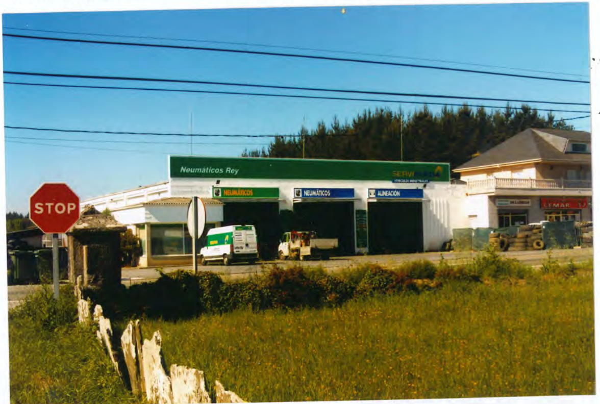
F.16. Nave de Ponciano

comercial-industrial destinado al almacenamiento y monta-