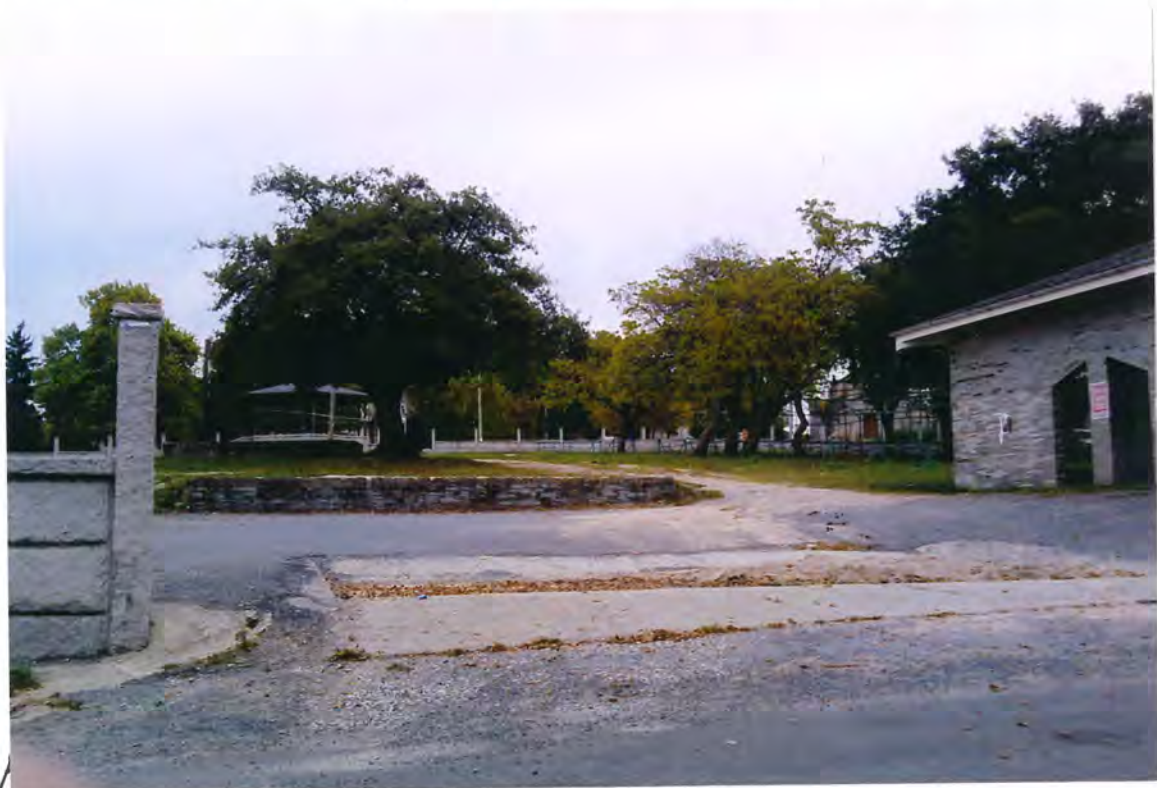
F-52- Campo de la feria de Aday

Otra a la Consejería de Agricultura, Ganadería e Montes, con destino a la "Feria Exposición de Hacia Rubia Gallega, que se celebró en Aday, el tres de Abril, con un presupuesto de 1.875.000 ptas.