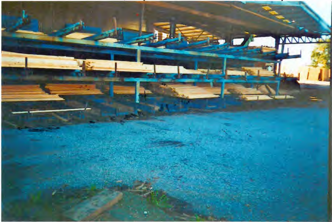
F.31 - Nave para la reforma y acondicionamiento de la transformación de la madera, de Eduardo Campo

de Campo Seijas en virtud de instancia n.º 408, solicitando licencia municipal para la instalación, apertura