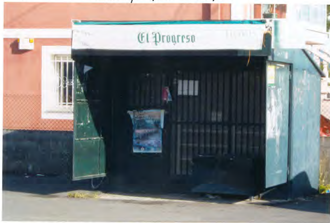
F.13. Kiosco en Cargo

momento del terreno se usaba por el citado kiosco, señalando otra ubicación para el mismo.