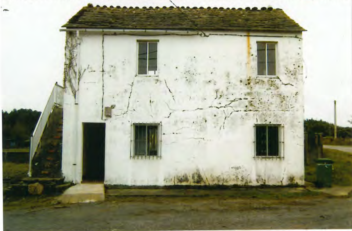
F17- Escuela de San Pedro de Farnadeiros

la de aquella parroquia, actualmente destinada a local de esparcimiento de los vecinos u al mismo tiempo (tal vez)