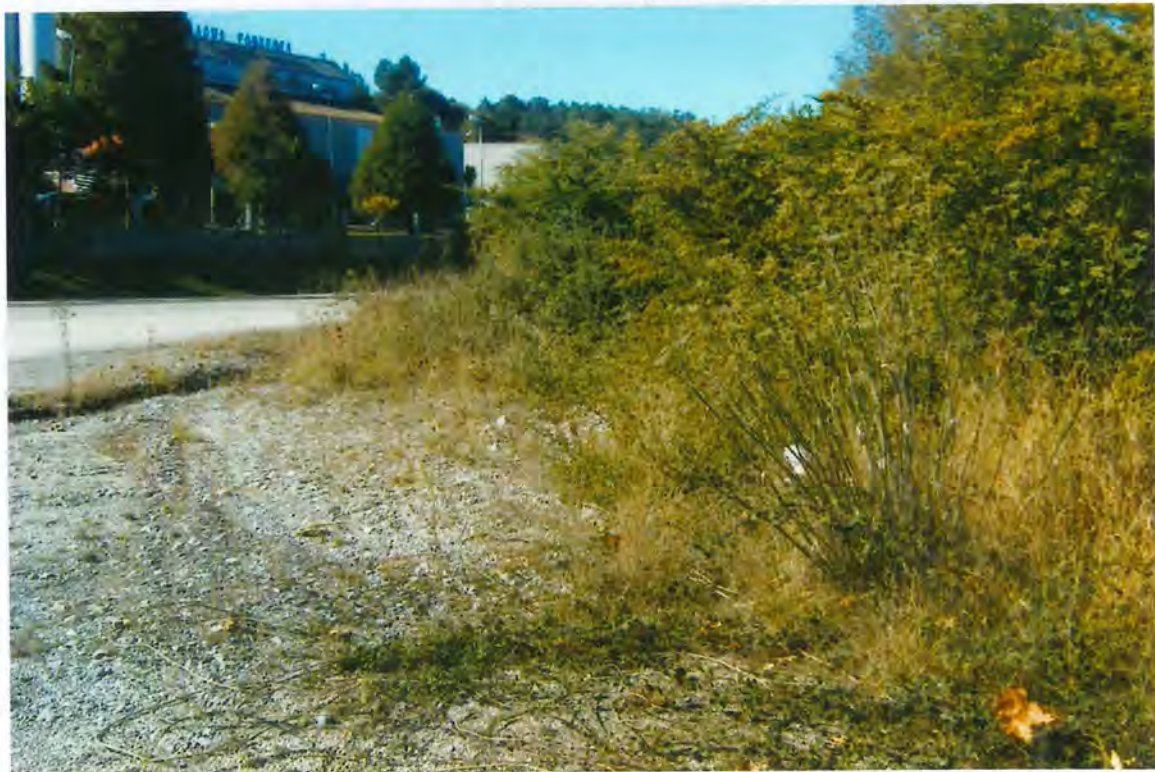
F36 Deslinde con el municipio de Láncaea, en Veiga de Anzue los

1º- Realizar el amojonamiento y, en su caso, deslinde,