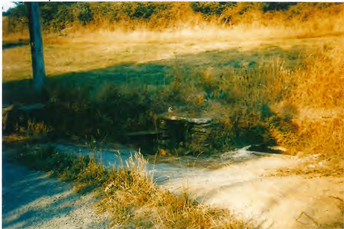
F43. Fuente de Quinte