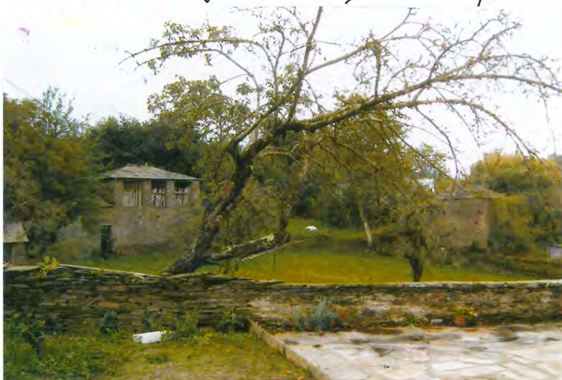
F 53 - Pueblo de Quinte

Tras prestar juramento en forma legal, tomó posesión como Concejal de este Ayuntamiento por el