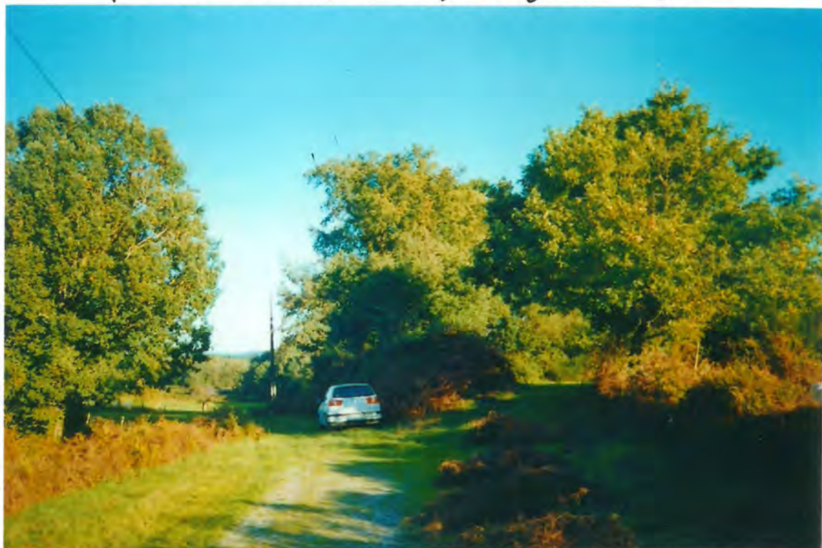
F 64. Camino a la Iglesia de Santia de Bergato