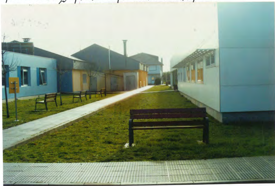
F9. Solar en el Cambeiro

Por la Presidencia se dió cuenta de que adquirido por el Ayuntamiento, previo concurso público, un terreno situado en el Cambeiro, inmediato al Centro de Salud, destinado para parque público, debía procederse a su ajardinamiento, para lo que ya se pidió presupuesto a la empresa "Viveros Masquera" de Lugo, por un importe de 563.696 ptas.