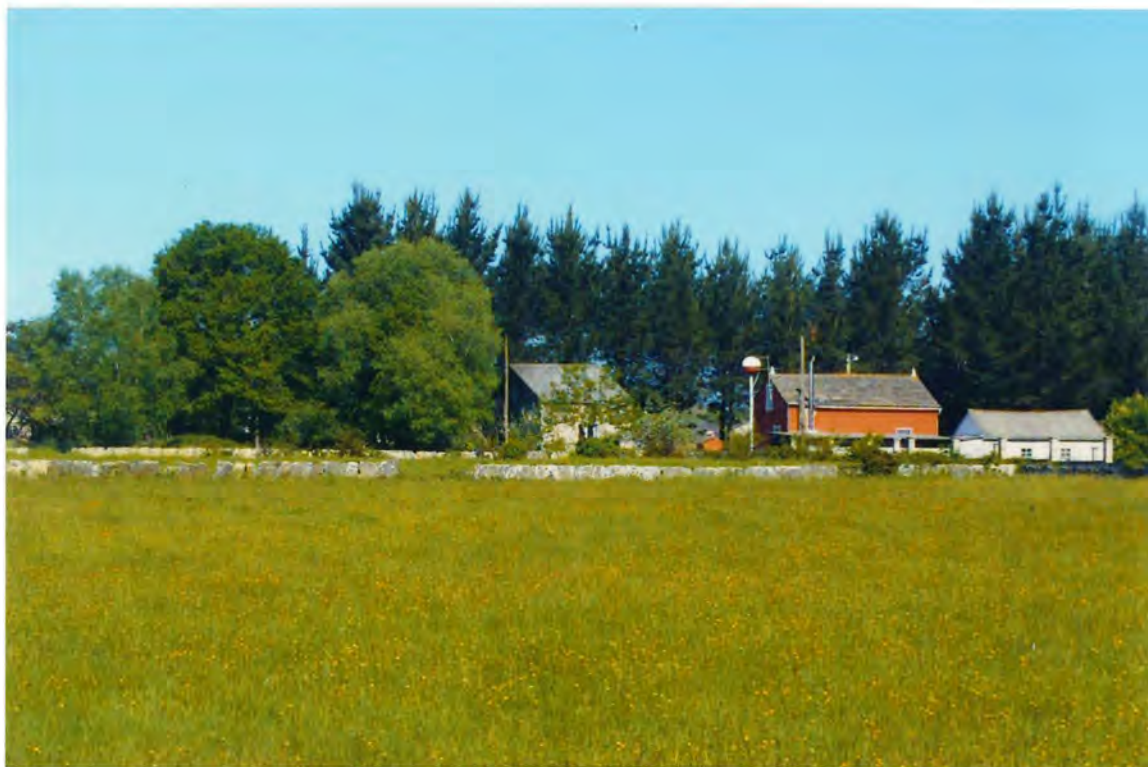
F. 4. Escuela de San Cristobal de Chamoso