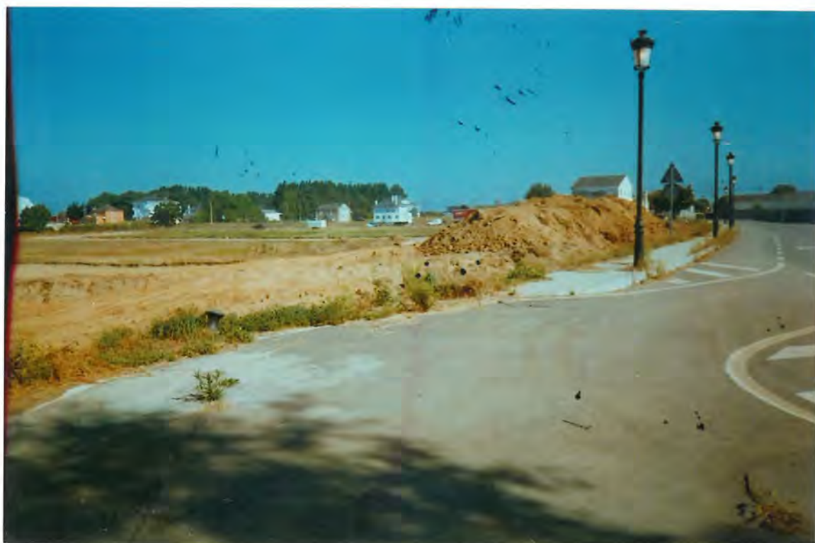
F-6. Alumbrado público, en el camino de la Iglesia de Corgo