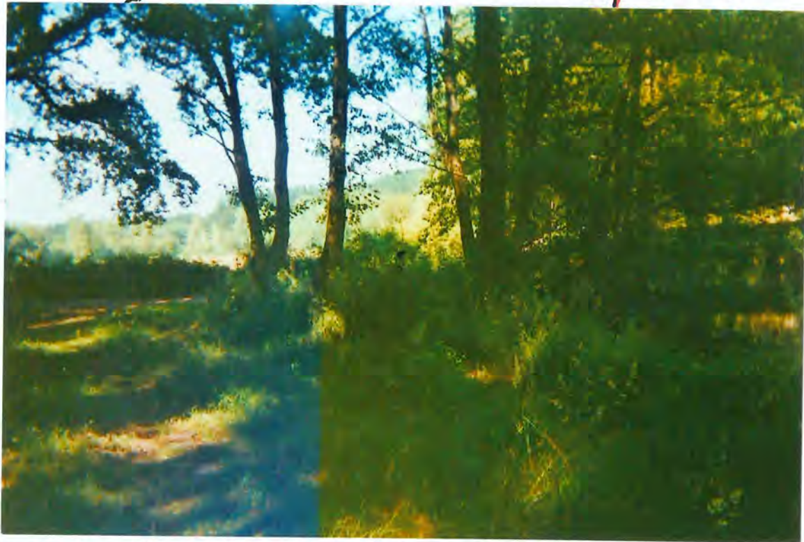
F 28 - Puente de Requeixo, sobre el Tordea

En sesión de veintitres de Febrero, se acordó aprobar las facturas del Colegio de Ingenieros de Caminos, importes de los honorarios de redacción de los proyectos técnicos de las obras del puente so-