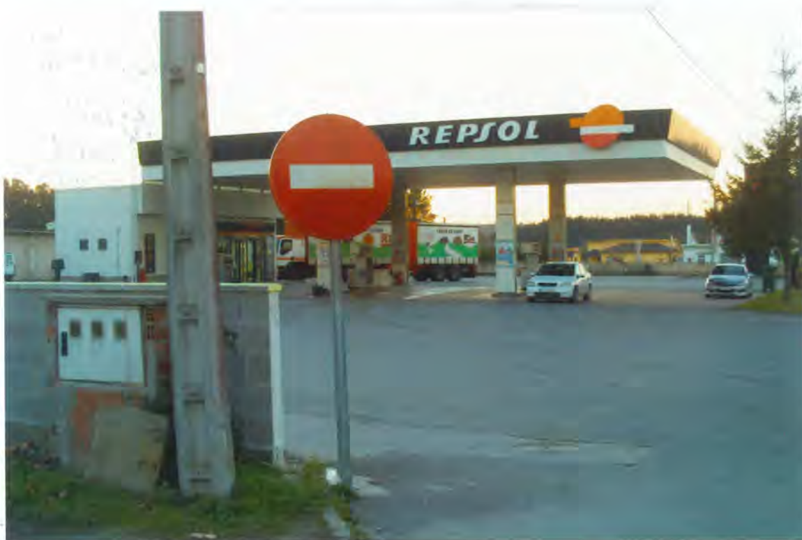
F34- Gasolinera de Lence

La Comisión de Gobierno por unanimidad acordó: Estimar el carácter de interés social de la edifica-