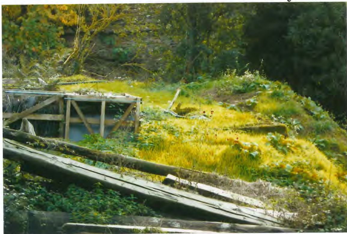
F45 - Depósito de purín - en Quinte