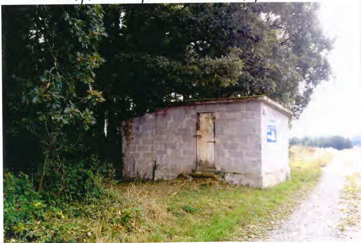
F. 12 - Báscula de Gomeán.

Seguidamente se aprobó unánimemente el presupuesto por la reparación de la caseta de la báscula pública de Gomeán, por un importe de 225.000 ptas.