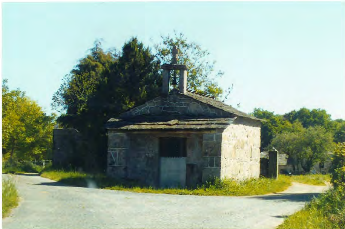
F. 3 - Capilla de San Marcos, en San Cristobal de Chamoso