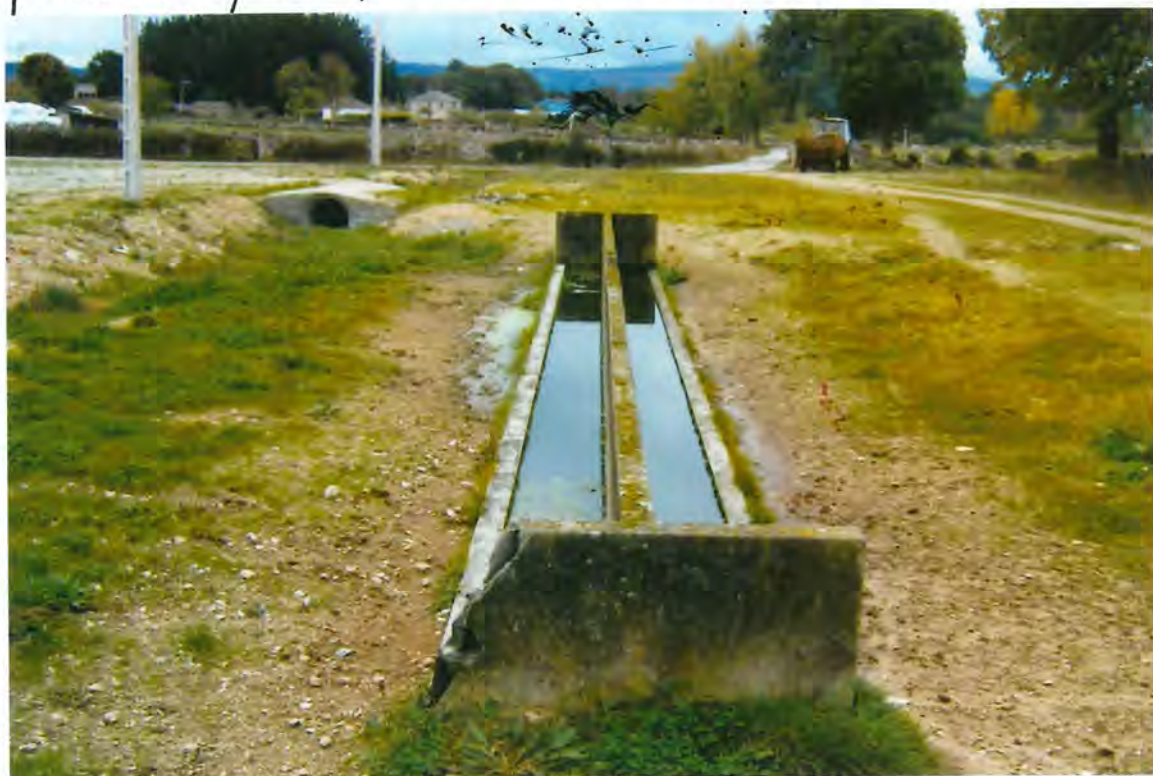
F. 41. Fuente de Lapio

A propuesta de la Presidencia, por unanimidad se acordó construir un lavadero municipal en Lapio, con un presupuesto de 250.000 ptas.