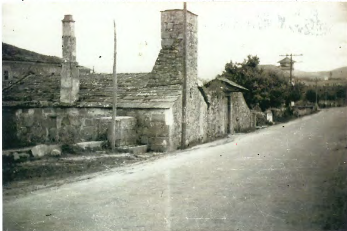
F 55- Parte N.E de la Plazuela donde se encontraba una fuente con valor histórico

"O cargo Concella sita na EA-VI, é inmediatamente al- tes do de Lugo, o lugar de paso obrigado para moitas ren- tes que proceden do Estado Español con dirección a diver- sas zonas de Galicia, sendo a principal vía de comuni- cación da nosa nación e tamén un das espaldas de la. Os visitan- tes poden observar as múltiples aberracións urbanísticas, xa que na maioría dos casos a construción non se axustan a tipoloxía da zona por falta dunha norma de respecto, tamén se pode ver a 150 m. da casa do Concella o lamentable estado en que se encontra unha plaza coñecida popularmente co- mo "Plazuela", donde anteriormente había unha fonte con va-