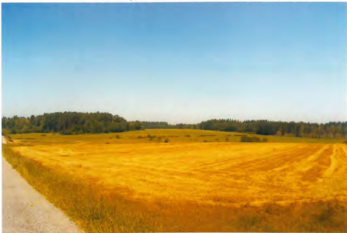
F 19 - Monte de Gomeán.

En sesión del Pleno del veintinueve de Abril, se acordó unánimamente delegar en la Comisión de Gobierno, la formación de las Juntas Electorales, designando por sorteo los Presidentes y Vocales de cada una, con referencia a las Elecciones Locales y al Parlamento Europeo, que tendrían lugar el próximo día diez de Junio. Todo ello de conformidad con lo establecido en la Ley Orgánica Electoral, Artº 25.