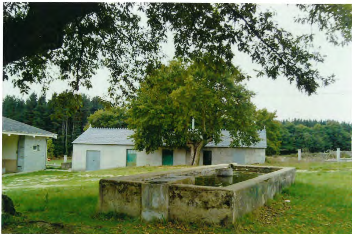
F-5- Fuente en el campo de la feria de Aday.