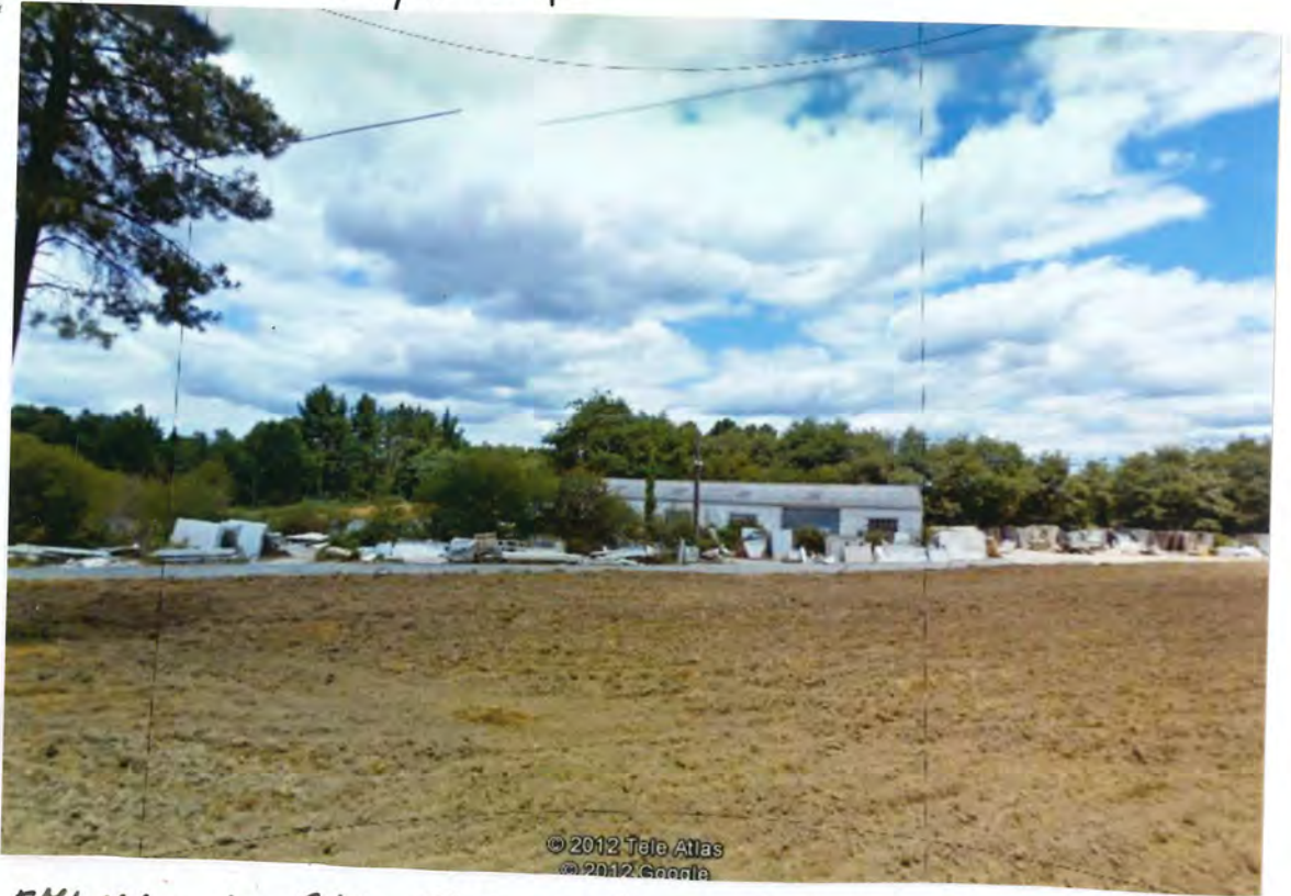
F71-Mármoles Adrio. Taller artesanal en piedra. Corgo