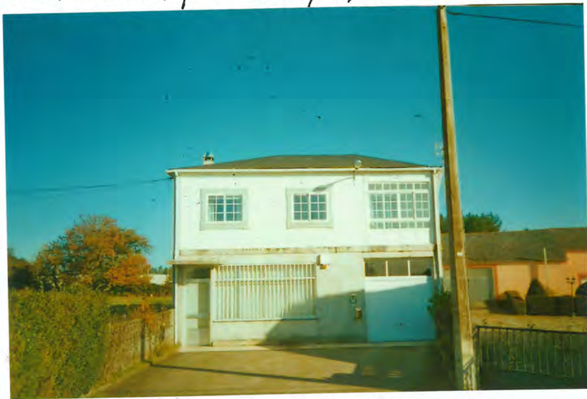
F49. Local donde estuvo situada la antigua Caja de Ahorro

La Comisión de Gobierno, por unanimidad, acordó conceder licencia provisional para tal traslado.