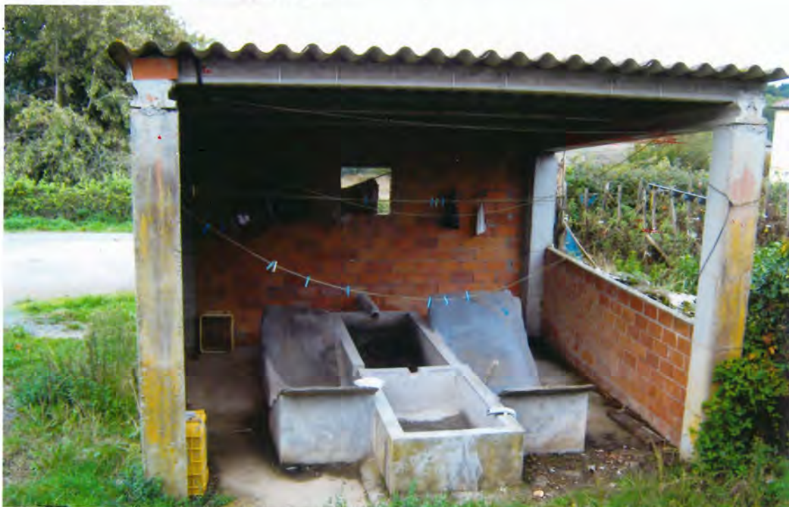
F-18. Lavadero de San Pedro de Farnadeiros

mandos según, solicitando se declare el monte "De Gandaras", de aquella parroquia como "Monte Residual en Mandos Común"