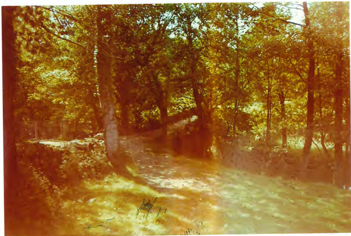
F 69 - Puente romano sobre el Tordea

También se dio cuenta del escrito del citado Ayuntamiento de Páncara, que comunicaba el acuerdo de aquella Corporación, de 14 de Diciembre de 1.992, de solicitar de la Junta de Galicia que realizara las obras necesarias para acondicionar y rehabilitar el "Camino Real", que bitursaba del "Camino de Santiago" en Frantria (Ariacastela), siguiendo por el Ayuntamiento de Páncara, pasando al de Corgo por el puente Romano sobre el río Tordea.