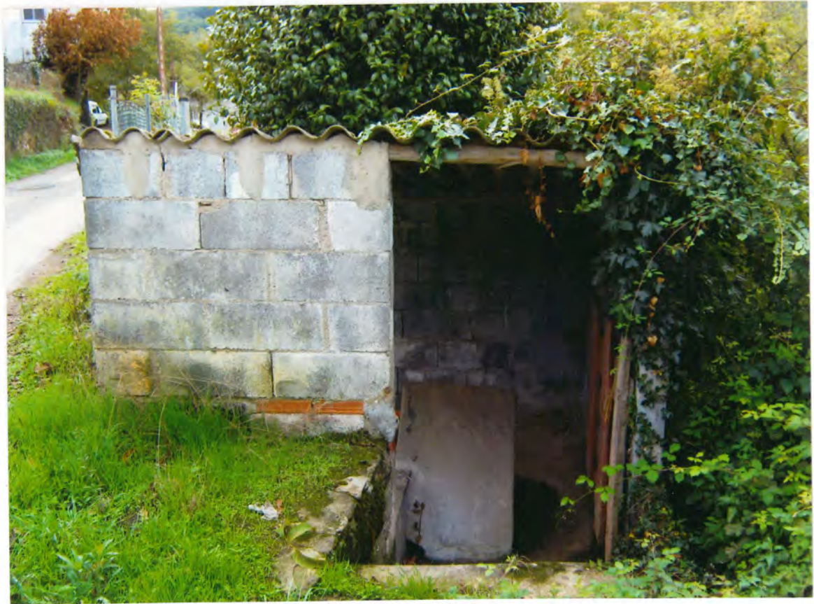
F 8 - Lavadero en Quinta