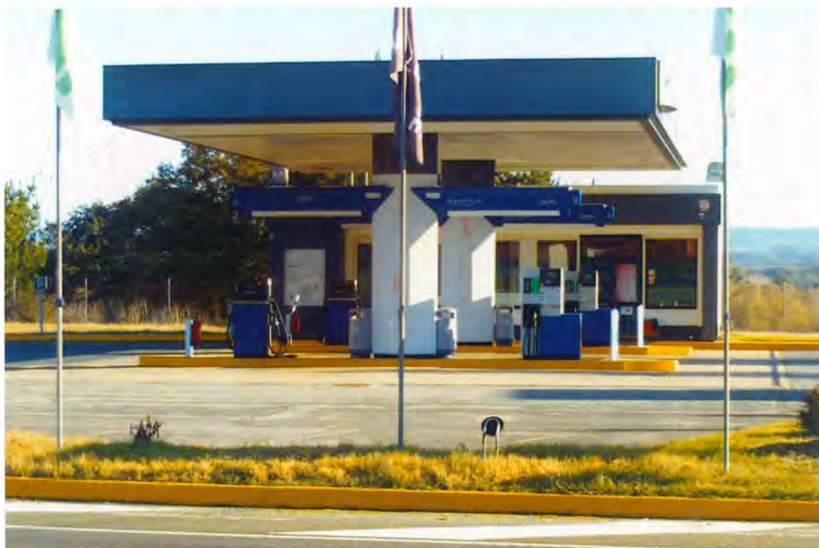
F. 49. Estación de Servicio de Sabarey