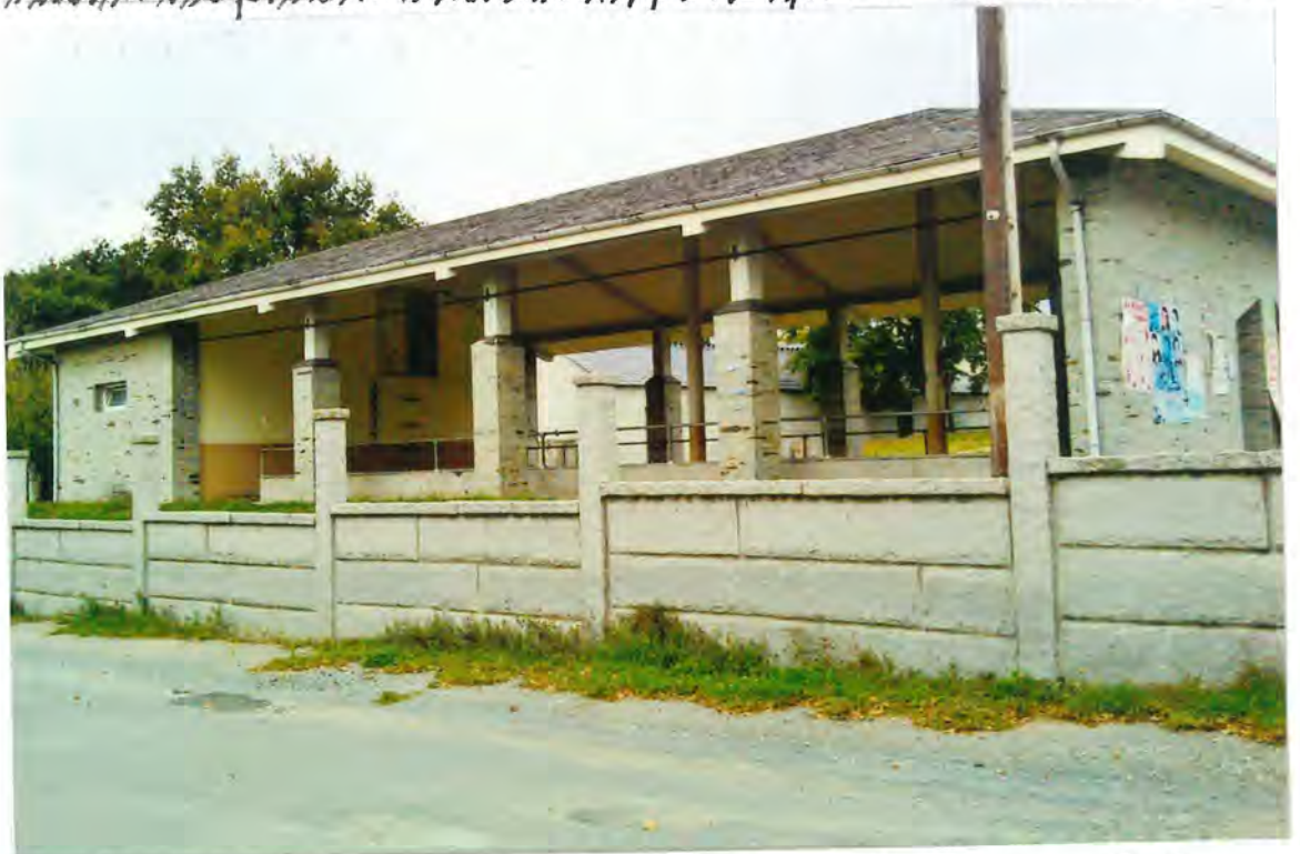
F11 - Pabellón cubierto en el campo de la feria en Aday

Conceder al interesado un plazo de quince días hábiles contados a partir del siguiente al de la notificación del presente acuerdo, para que retirase el citado