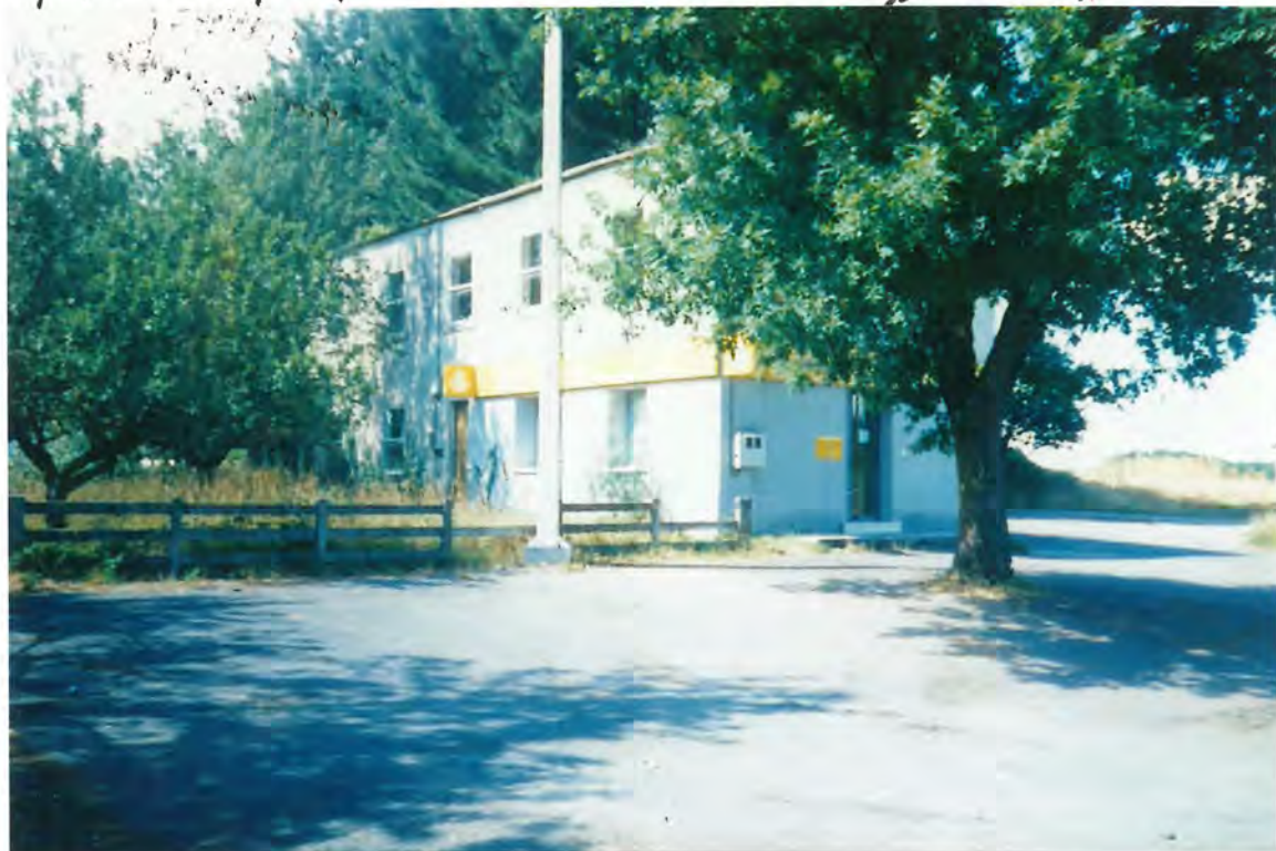
F.62 - Correos, en la Escuela Vieja de Corgo

Aprobada unánimemente la urgencia del asunto y tras breve debate asimismo por unanimidad, se acordó aprobar la propuesta del Sr. Alcalde y ceder para tal