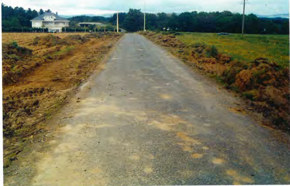
F29. Camino de Corgo a Sanfiz de Bergazo