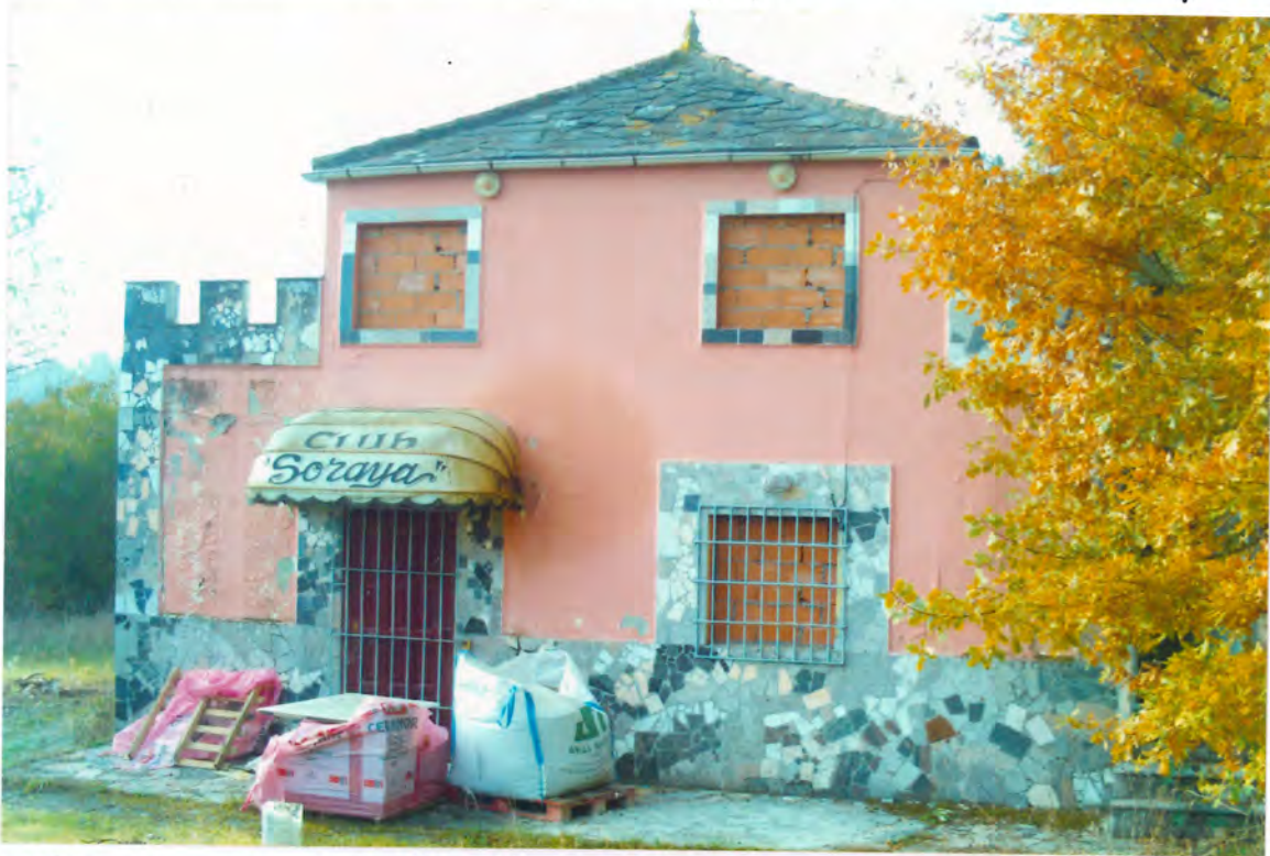
F. 59 Casa n.º 44 de Corgo