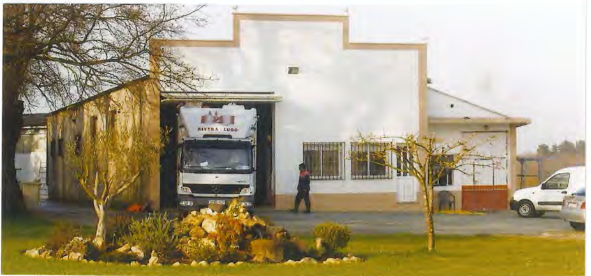
F-69 - Productos cárnicos envasado. En San Pedro de Farnadeiros