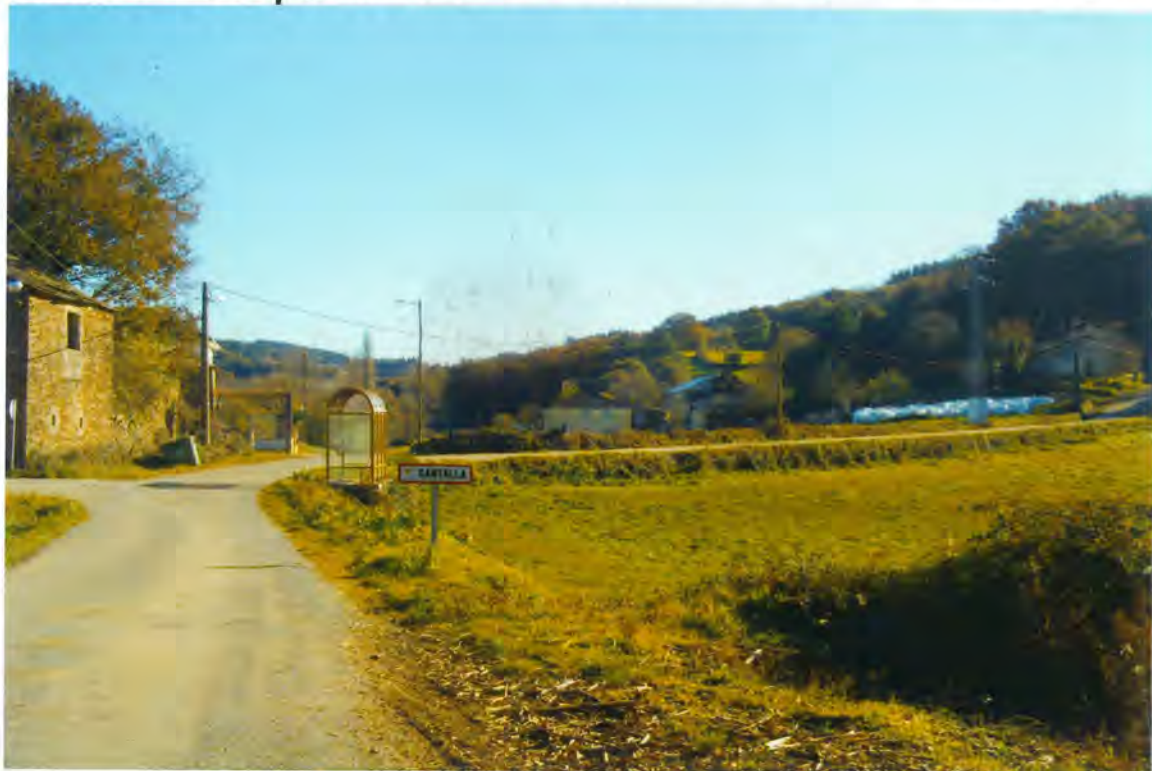
F27 - Camino de Santa Eulalia del Alto