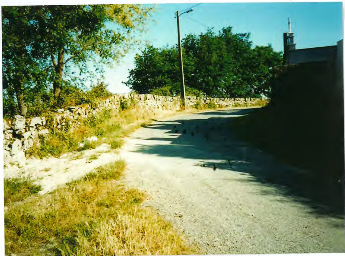
F32. Acceso a la Iglesia de San Juan de Corgo