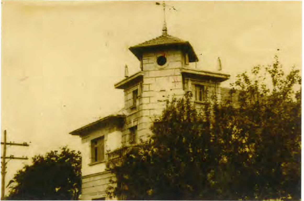
F 23. Casa Consistorial antigua, año 1950

anulada la subvención concedida por la Junta de Calificación con destino a la misma, caso de no poder ser