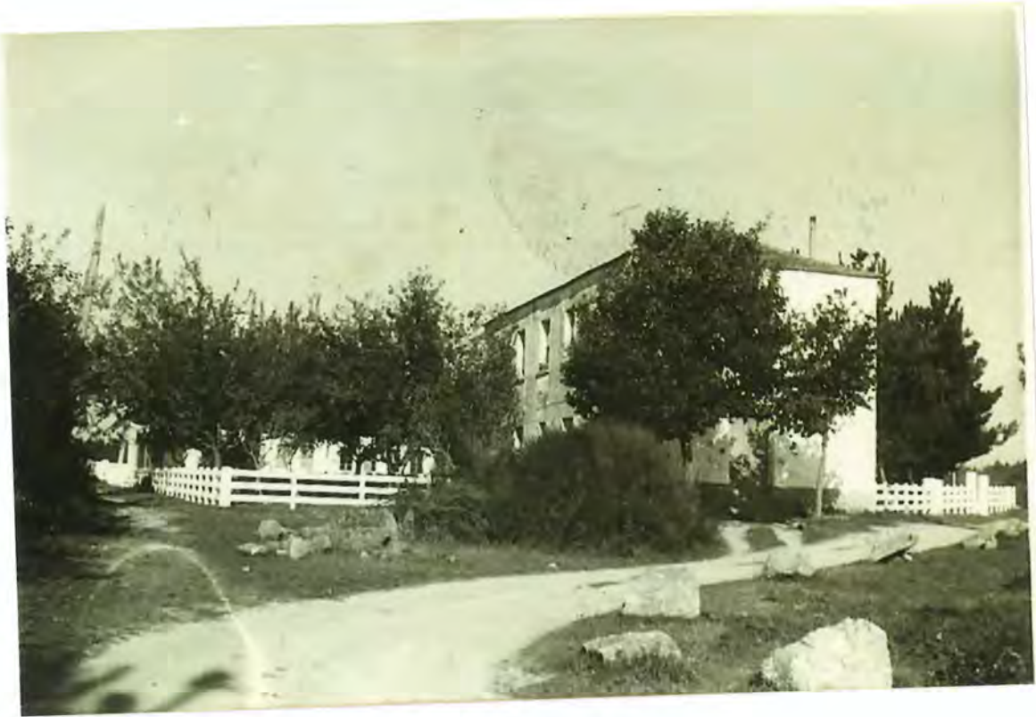
F59. Escuela antigua de Cargo