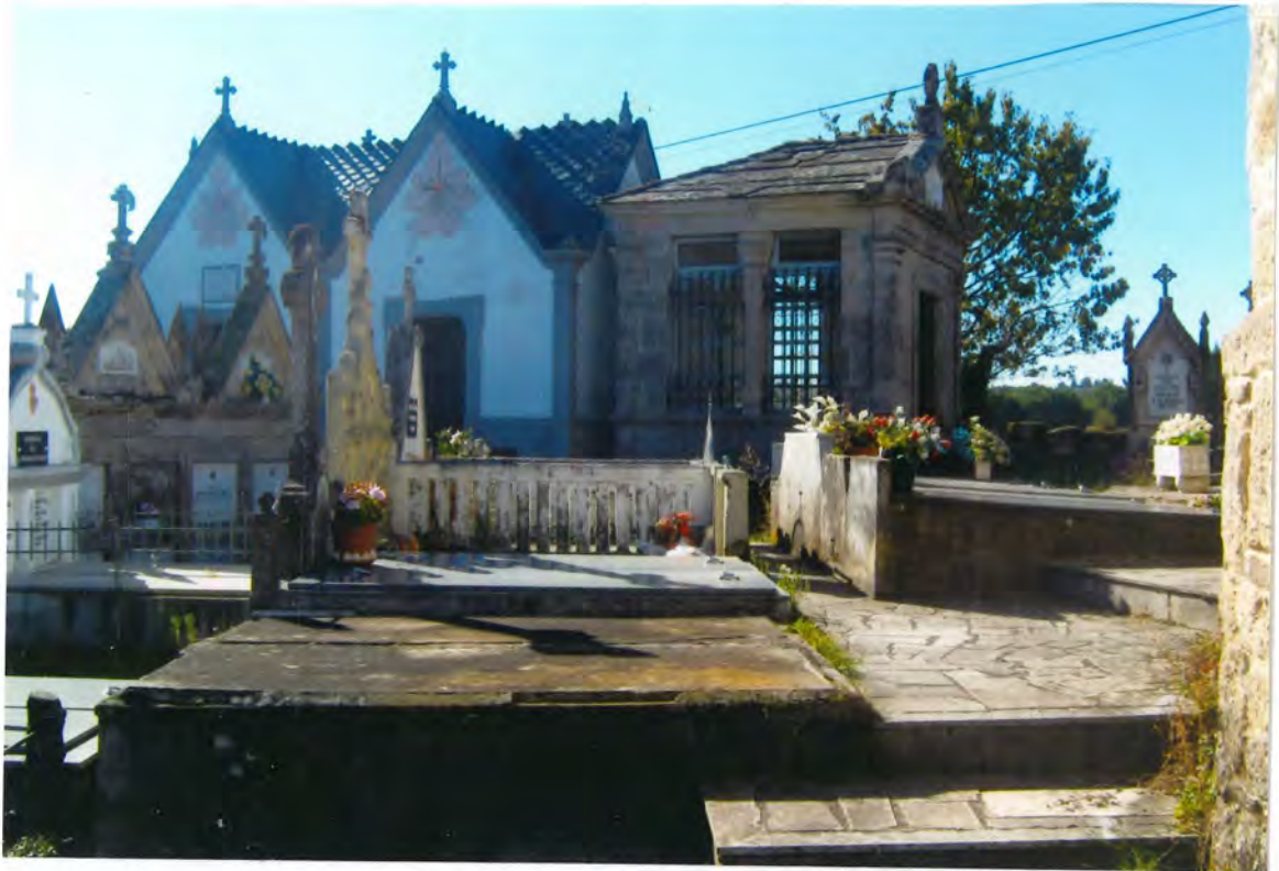
F1- Sepulturas en el antiguo Cementerio de Gomeán