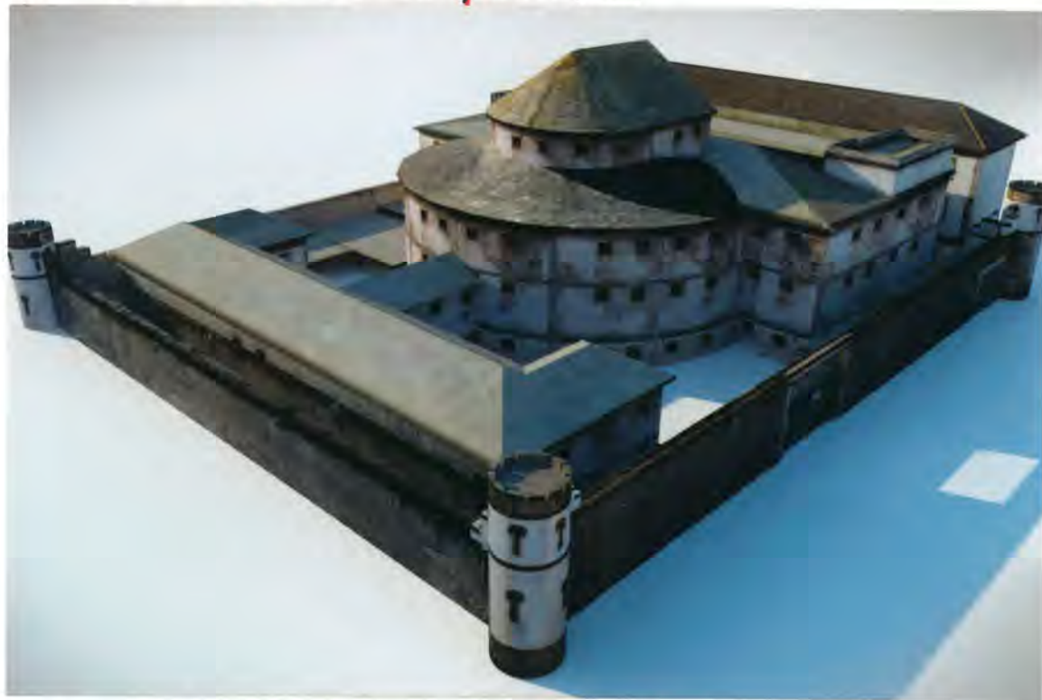
F. 10 - Vista aérea de la Carcel de Lugo

Dado cuenta del escrito de la Ilma. Sra. Delegada Provincial de Hacienda, de 22 de Septiembre pasado, referente a la reversión de un inmueble sito en Lugo, en su día donado al Estado por los Ayuntamientos que componían el Partido Judicial de Lugo, entre los que se encontraba este de Corzo, con destino a "Prisión Provincial", y de la copia del informe al efecto emitido por la Asesoría Jurídica de la Dirección General del Patrimonio.