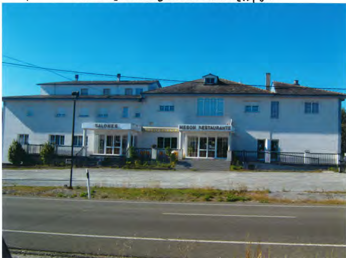
F.33 - Hostal Prados