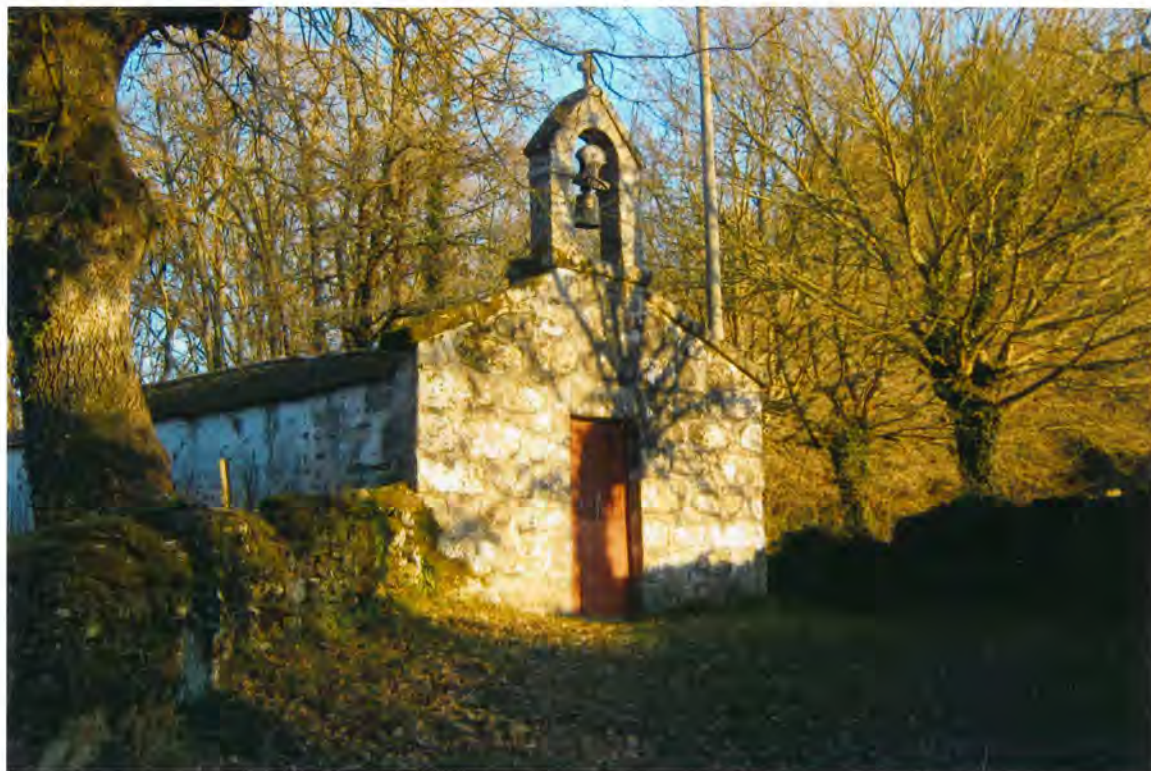
F14- Capilla de Abragán.

casa de Vivero hasta el empalme del camino de la Capilla en Abragán , mediante prestación personal de aquellas y aportación de piedra por parte del Ayuntamiento.