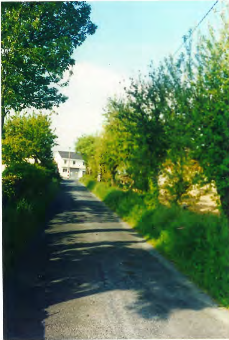
F 21-Carretera a Sanza de Bergazo, antes del ensanche