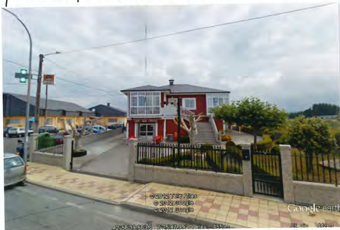
F 35 - Bar Centro, en Corgo