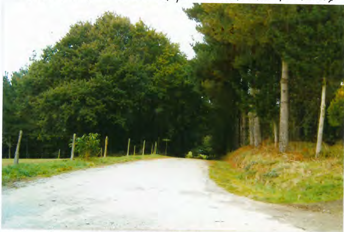
F.44 - Camino la Fental, en Quinte

Que a dicha subasta se presentaron ocho licitadores