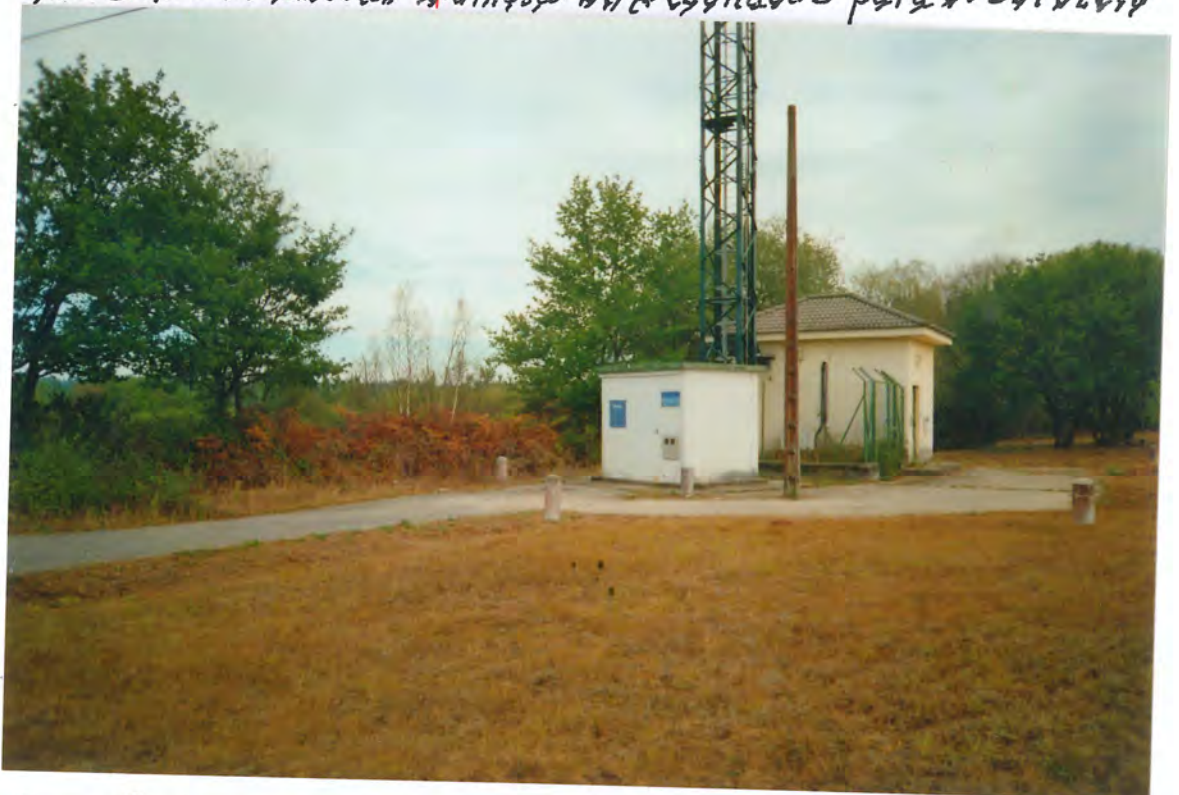
F. 56. Central Unidad remota de Abonados Telefónica

La Compañía Telefónica Nacional de España en escrito nº 3504/91, solicitaba a este Ayuntamiento la cesión de un terreno de 5'50 x 3'80, para el emplazamiento de una Central Unidad Remota de Abonados para el servicio