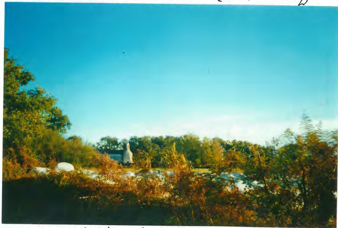
f22 - Vista de la Iglesia de San Fco de Bergazo, desde el camino

El Sr. Alcalde-Presidente dió cuenta de la subvención concedida por la Exma. Diputación Provincial, con destino al C. M. "Desde la C. 2-VI, en Cargo