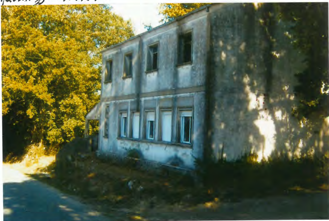
R. 65- Escuela de Franqueán

En sesión ordinaria del Pleno, del día veintinueve de Julio y visto el escrito no 03538, de 23-V-83, del Ilmo. Sr. Director General de Educación, de la Consejería de Cultura y Juventud, que contenía la resolución del expediente tramitado, por la que se concedía a este Ayuntamiento una subvención de 1.000.000 de pesetas con destino a reforma y equipamiento de las edificaciones en las que radicaban las antiguas escuelas de Franqueán y Cerceda.