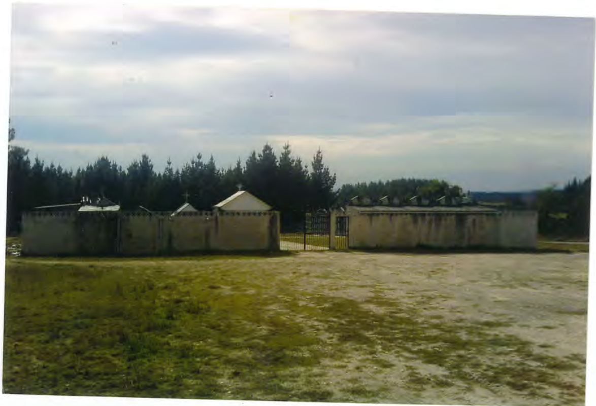
F2- Actual Cementerio de Gomeán