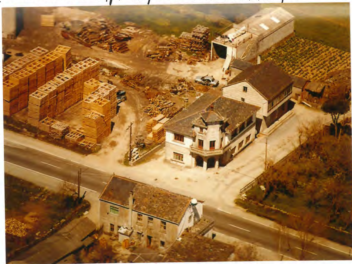
F-26-Vista aérea de la Consistorial reformada

En sesión extraordinaria del Pleno del día veintiocho de Diciembre la Corporación por unanimidad, acordó declarar válida la licitación y elevar a definitiva la adjudicación de la citada obra a favor de Capón y Fernández, S. L., por el precio de 11.940.000 ptas.