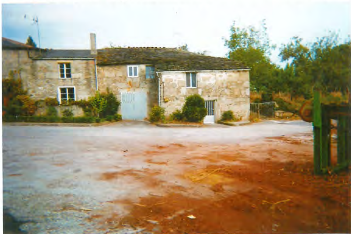
F-67. Deslinde del terreno de la sierra

En sesión extraordinaria del pleno del día seis de Noviembre y a propuesta del Sr. Alcalde y de conformidad con el dictamen de la Comisión de V ida, O bras y S er- vicios P úblicos, la Corporación acordó unánimemente ini-