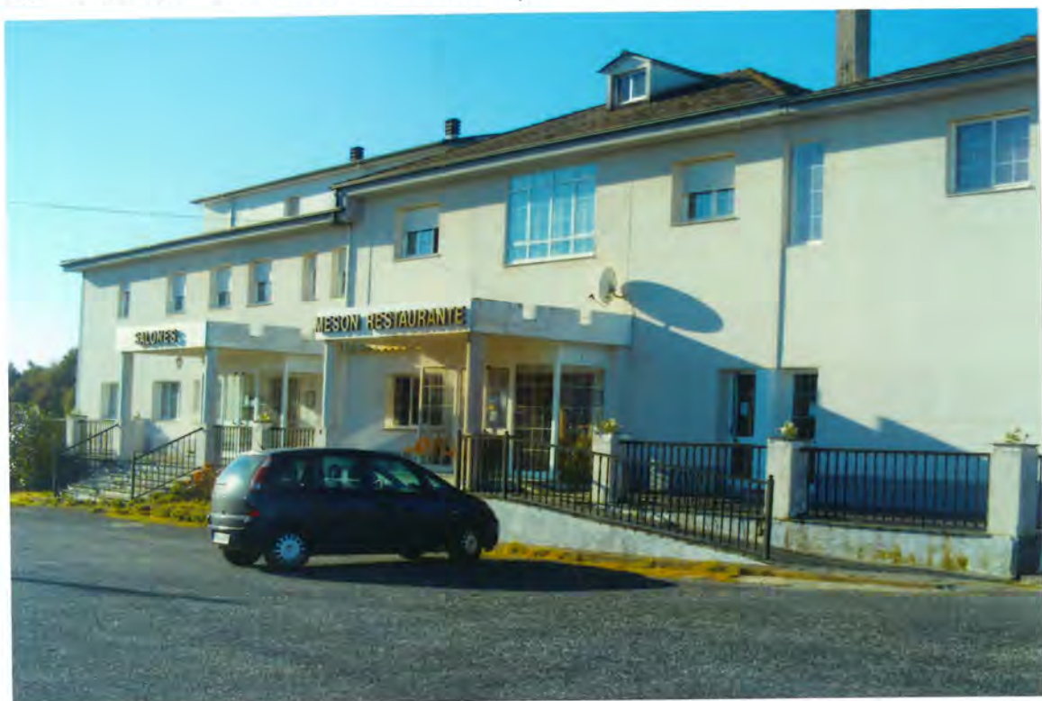
F 50. Hostal Alborada