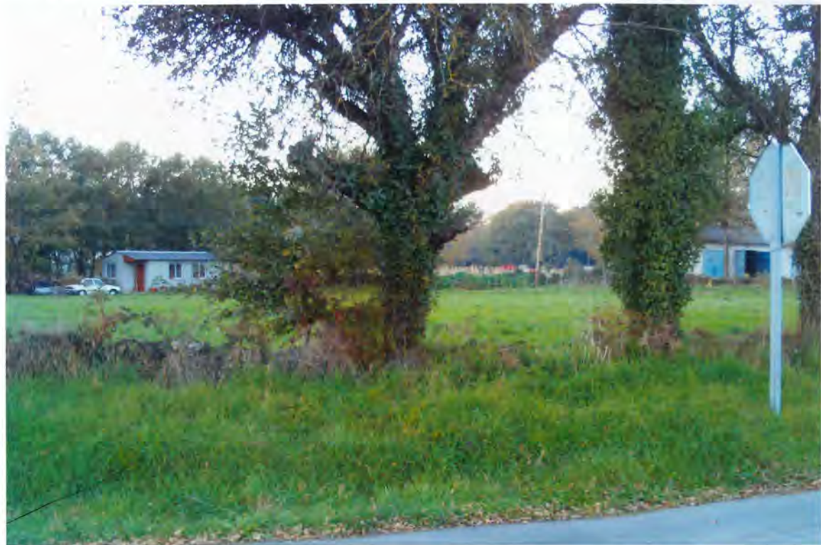
F-37. Finca de Antonio Mosquera Candal

parte superior hasta alcanzar una altura de 1.800 m. son las correspondientes columnas y portales de entrada.